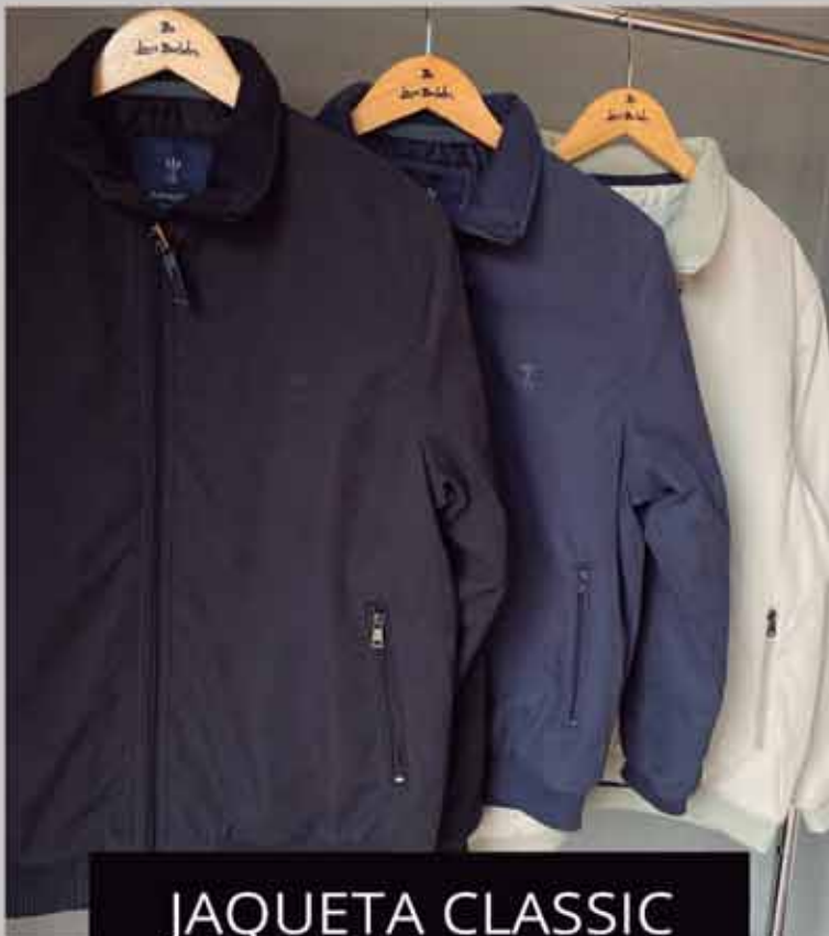
JAQUETA CLASSIC R$569,90