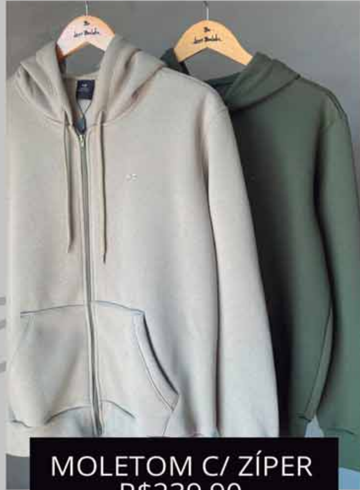
MOLETOM C/ ZÍPER R$239,90