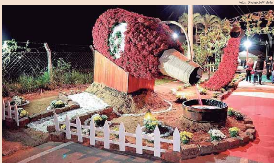
Santana terá decoração especial para a Festa do Vinho