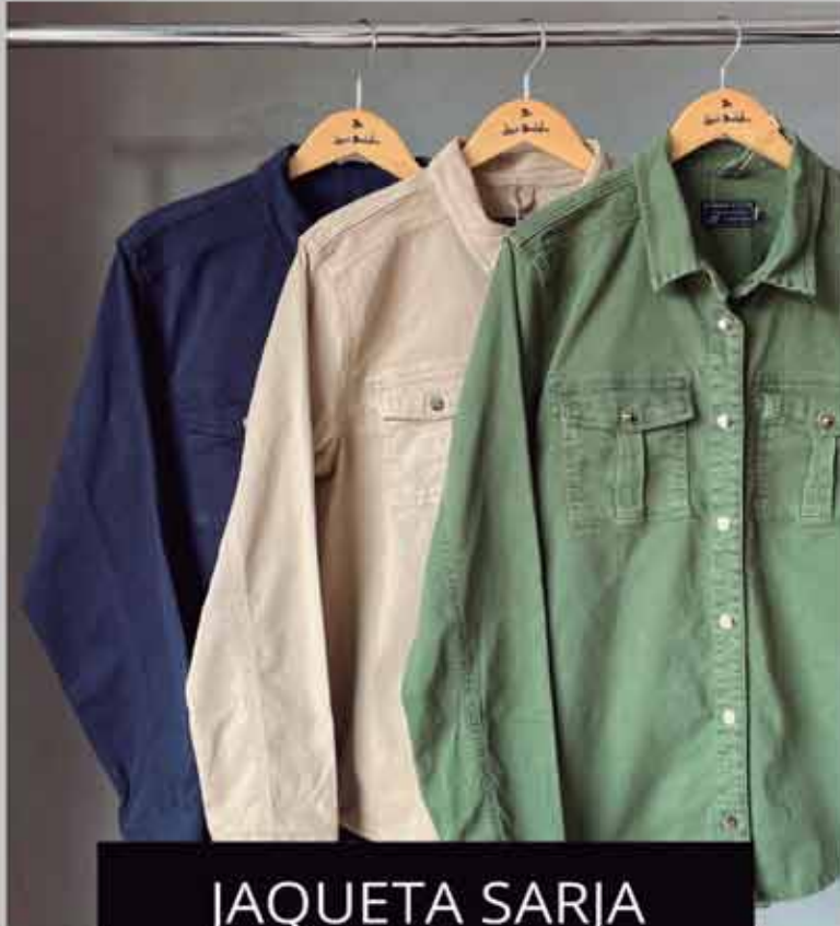
JAQUETA SARJA R$349,90