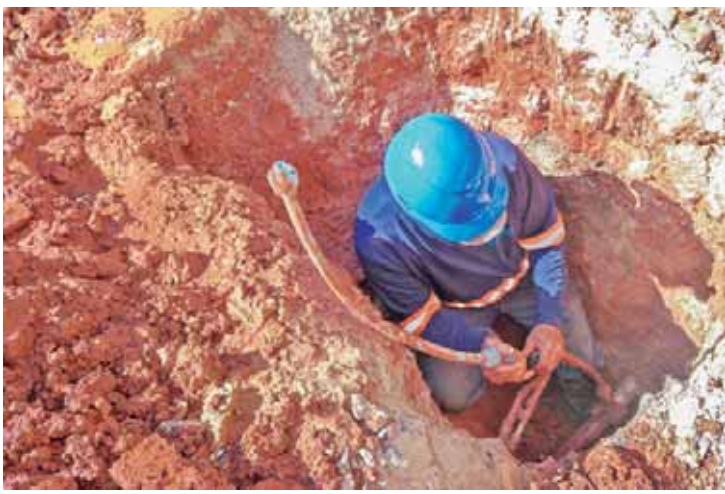
Truchos com vazamentos estão sendo substituídos por materiais novos na rede do Sema