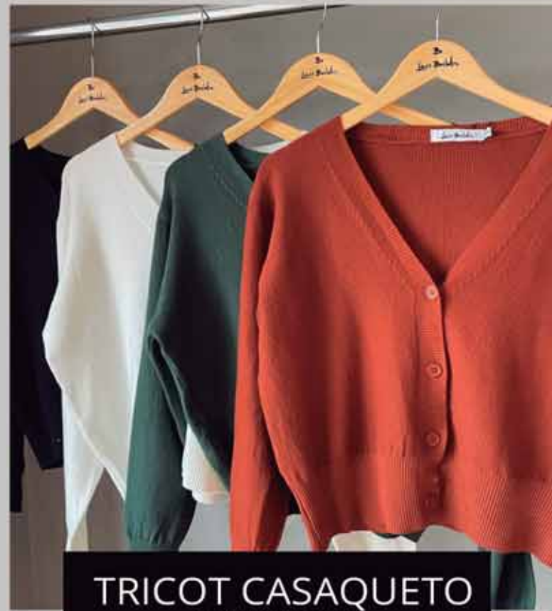
TRICOT CASAQUETO R$199,90