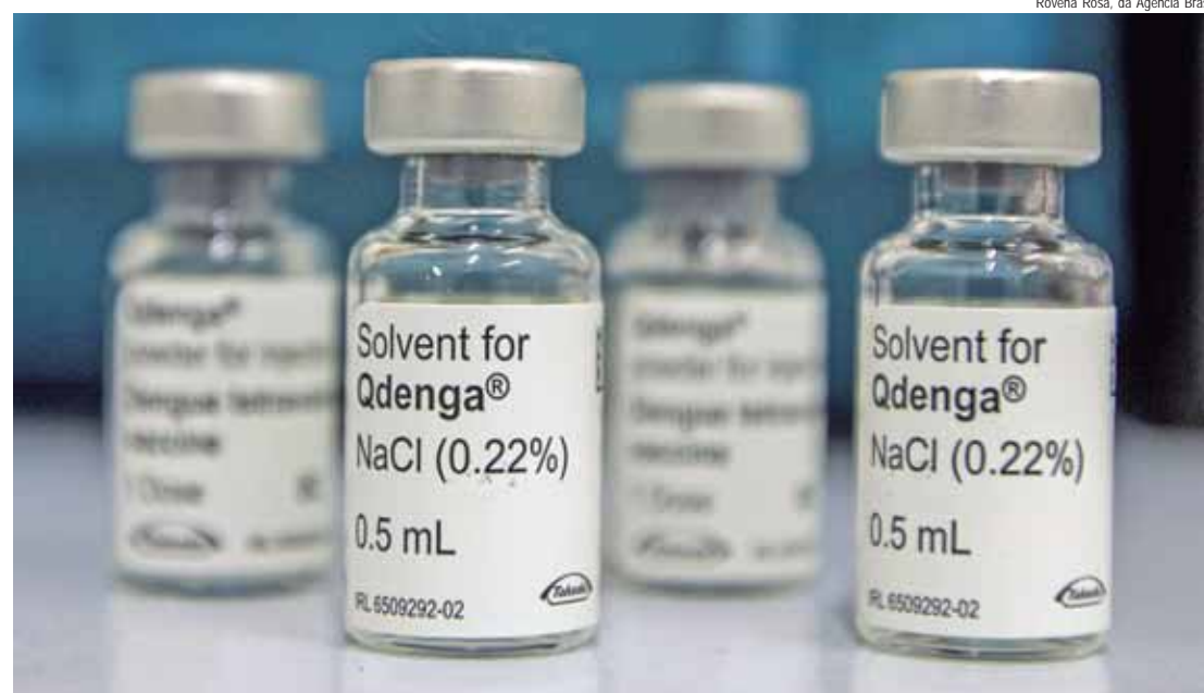
Vacina Qdenga, a partir do dia 19 disponível nas unidades de saúde

A vinda da vacina será muito importante para a cidade conforme destacou o prefeito Luciana