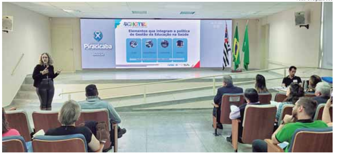
Plenária Municipal abordou três eixos especiais de discussão

Com o tema Democracia, Trabalho e Educação na Saúde para o Desenvolvimento: Gente que faz o SUS acontecer, a Plenária Municipal elaborou suas propostas a partir dos três seguintes eixos: 1 - Democracia, controle social e o desafio da equidade na gestão participativa do trabalho e da educação em saúde; 2 - Trabalho digno, decente, seguro, humanizado, equânime e democrático no SUS: uma agenda estratégica para o futuro do Brasil; e 3 - Educação para o desenvolvimento do trabalho na produção da saúde e do cuidado das pessoas que fazem o SUS acontecer: a saúde da democracia para a democracia da saúde. No Eixo 1, foram aprovadas as seguintes propostas: Em âmbito estadual - Criar espaços de inteligência intersetoriais e interinstitucionais que promovam a comunicação sobre o SUS, abrangendo seus princípios da Universalidade, Equidade e Integralidade, divulgando as suas boas práticas e experiências exitosas, estimulando Comissões Locais e Conselhos Municipais, Estaduais e Nacionais de Saúde, colaborando assim para a construção de uma imagem afirmativa e positiva do SUS. Em âmbito Nacional - Criar Encontros Municipais, Estaduais e Nacionais de valorização e mobili-