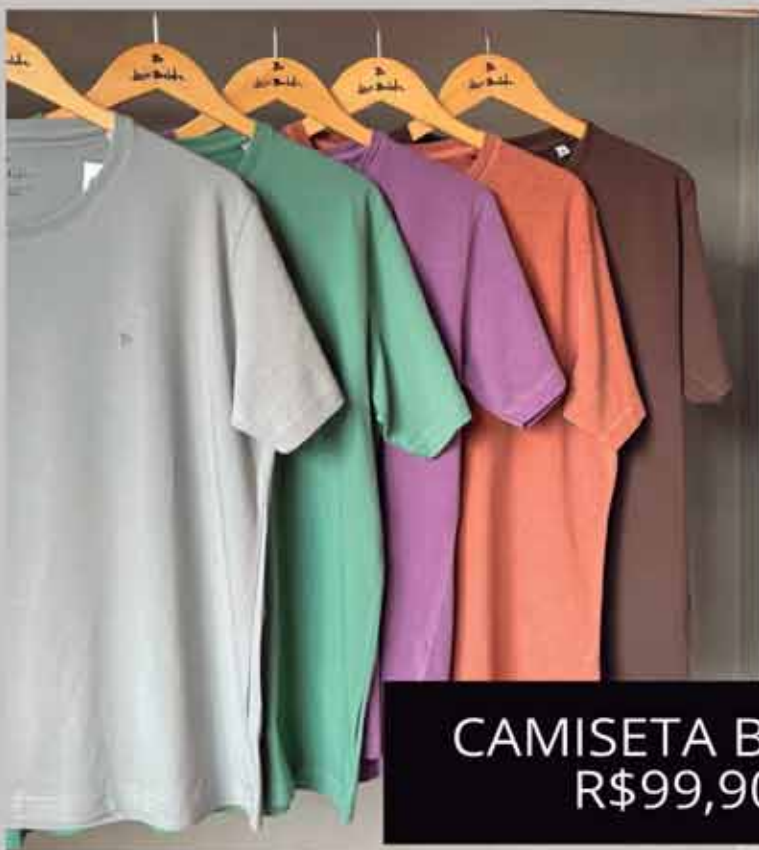
CAMISETA BÁSICA R$99,90