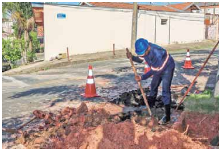
Trabalhos de reparo de vazamentos iniciados na Rua Américo Vespúcio, na região do bairro Algodal