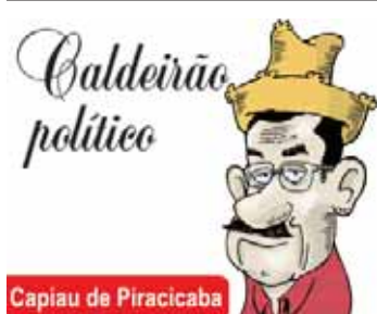
Capiu de Piracicaba

costelinha defumada. Canedergli, Spaghetti, cuscutz tradicional, caçarola italiana e trufa de vinho são outros pratos típicos que serão comercializados na 13ª Festa do Vinho ao longo dos três dias. A festa acontece na praça e no salão de eventos de Santana, com comercialização de vinhos produzidos no bairro, comidas e danças típicas, desfile da Rainha e Embaixadora da festa, entre outros atrativos.