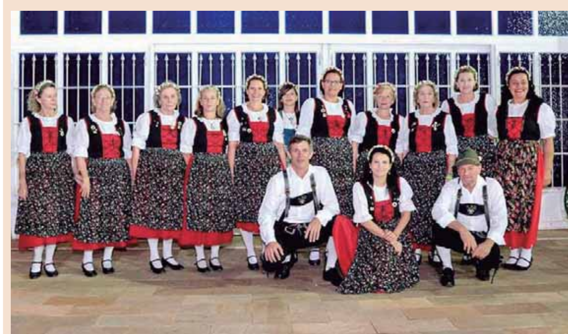
Grupos de dança de Santana se apresentam na festa