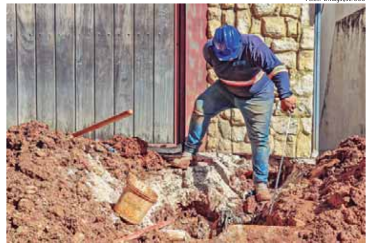
Serviço de manutenção da rede de água do Sema