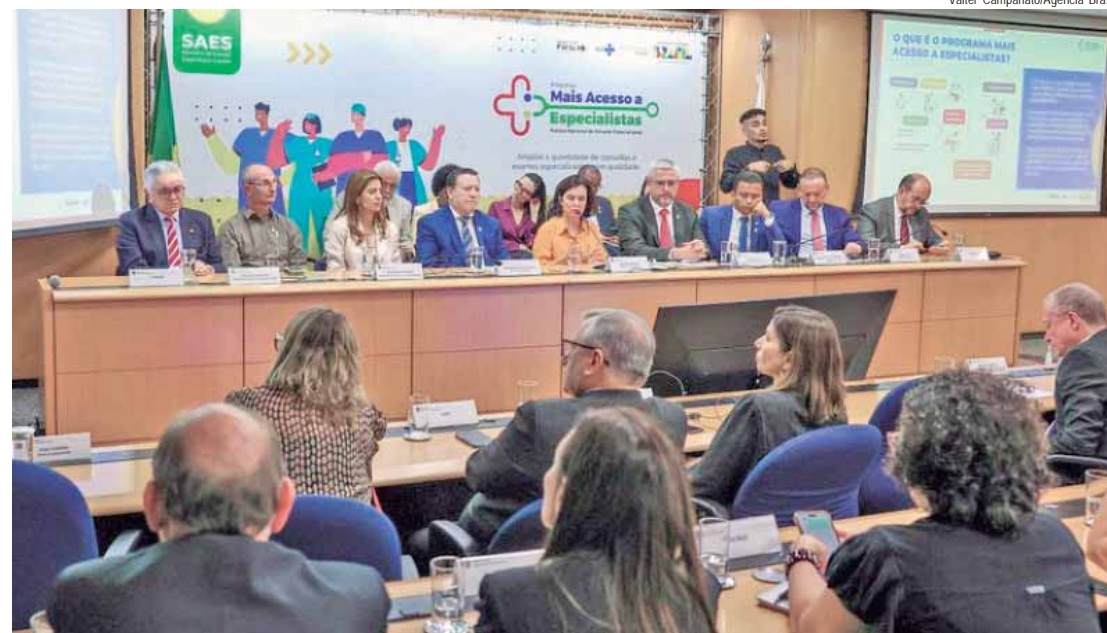
A ministra da Saúde, Nísia Trindade, na apresentação da estratégia do Programa Mais Acesso a Especialistas, que visa dar mais agilidade ao processo para marcação de consultas e realização de exames no SUS

"É um programa que tem por objetivo ampliar e tornar mais rá-