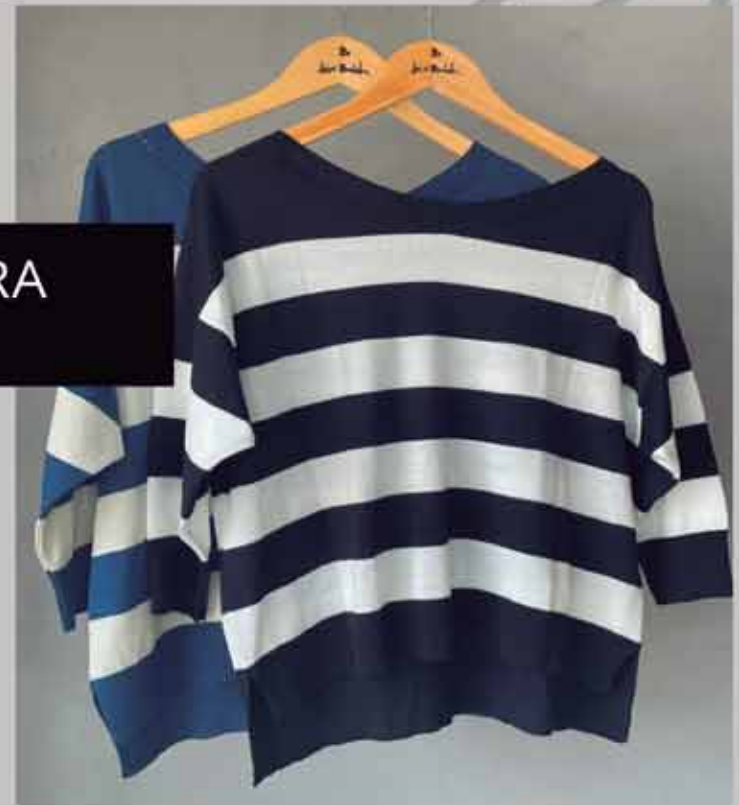
TRICOT ZARA R$149,90