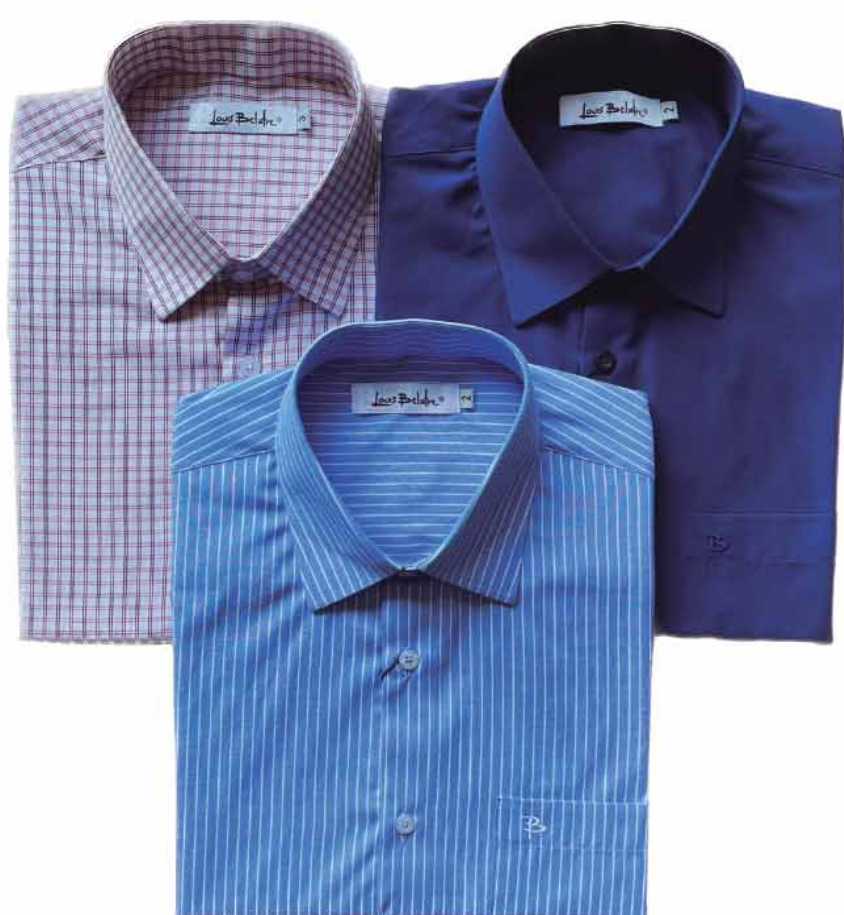
CAMISA MASCULINA BIS MANGA CURTA R$119,90