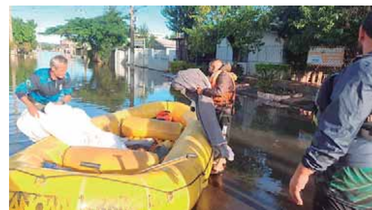
Força-tarefa foi mobilizada para apoiar equipes de salvamento nas áreas afetadas por enchentes