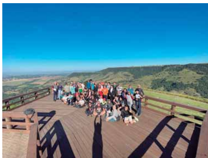
Caminhada Ecológica ao Alto da Serra

Para o dia 7 foi programada a 2ª Noite das Estrelas: Observação Guiada de Astros, quando em uma noite sob o céu estrelado, os participantes terão