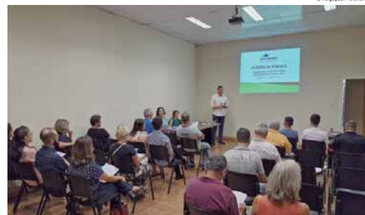
Audiência pública LDO 2025 realizada dia 21 passado

Agora a proposta segue para a avaliação da Câmara Municipal, que precisa fazer a votação antes do processo.