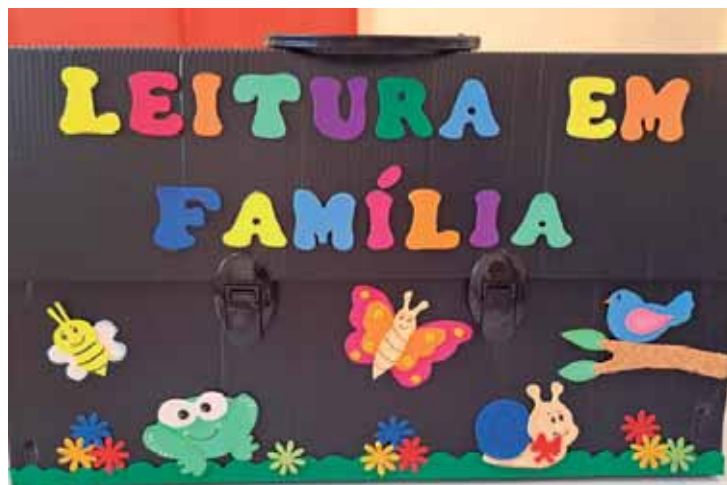
Atividade também nas escolas municipais para diversas faixas etárias

"É comprovado empiricamente e cientificamente, que a leitura contribui para o desenvolvimento da imaginação, do foco, da atenção e do aspecto socioemocional da criança", diz a coordenadora. Após a leitura, a criança é estimulada a desenhar, da maneira que quiser, sobre a história ouvida. E pode, ainda, pintar o desenho de um rosto impresso em um papel de acordo com o que ela achou da história. "E a pasta contém, ainda, um papel para que os responsáveis anotem tudo o que consideraram importante nesse momento de leitura em família", acrescenta a coordenadora, que celebra o resultado do projeto, destacando dois comentários e avaliações dentre os vários já recebidos dos pais dos alunos.