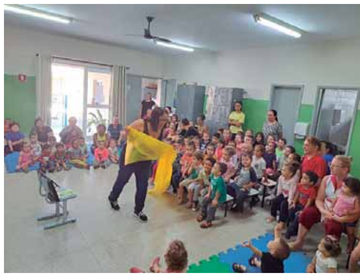
Atividades acontecem desde o bercário até o ensino fundamental I