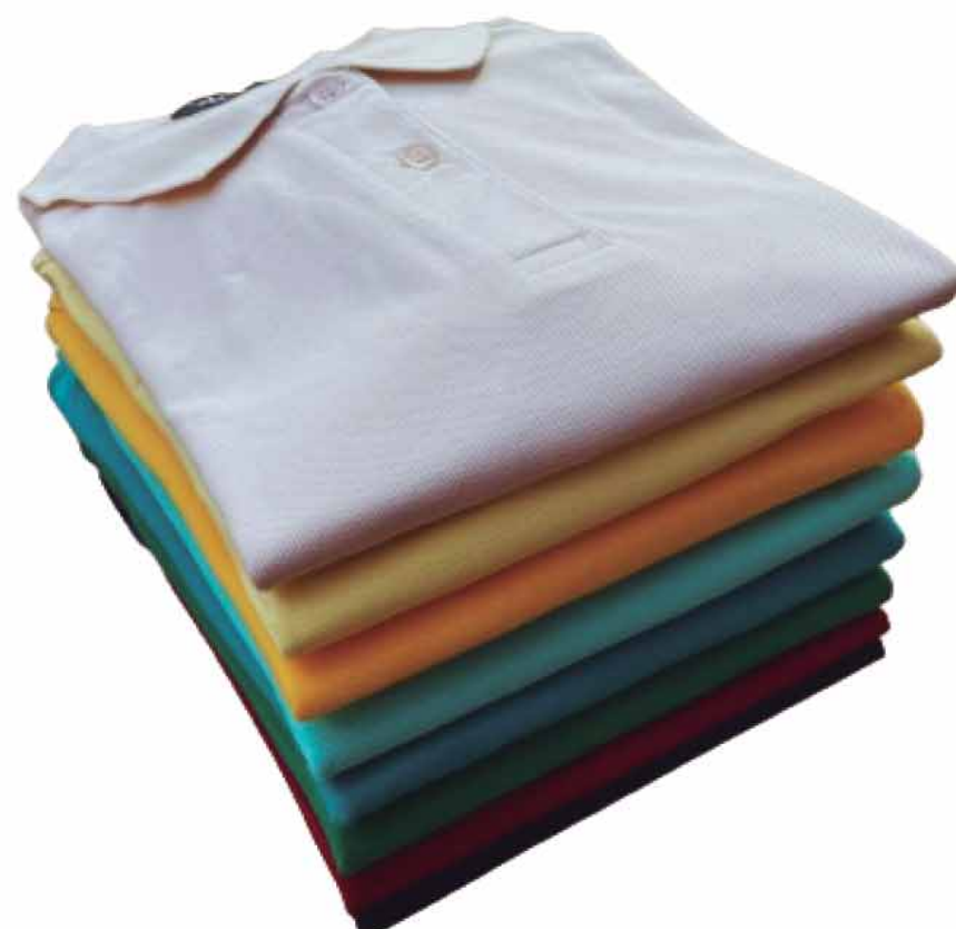
POLO MASCULINA R$99,90