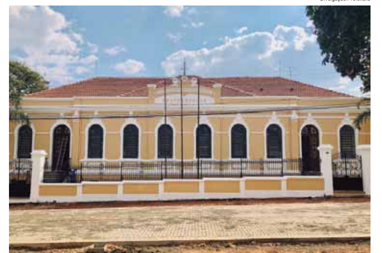
O Museu Gustavo Teixeira é um dos destaques para os passeios da Melhor Viagem

Em um estado plural e rico como São Paulo, receber esse destaque como destino para o público da Melhor Idade reforça o papel de São Pedro como um dos principais destinos turísticos do interior, impulsionando ainda mais a vocação da hospitalidade e da gastronomia são-pedrenses, abrindo um mercado muito maior para as empresas ligadas ao Turismo da cidade.