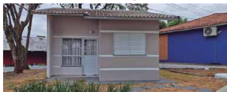
Casa modelo está localizada ao lado da sede da Guarda Civil Municipal, nas proximidades da Feira do Produtor

sados em adquirir os imóveis começam no dia 27, no escritório da Eco-vita, ao lado da casa modelo, localizada ao lado da sede da Guarda Civil Municipal, nas proximidades da Feira do Produtor e serão realizados mediante agendamento. No dia 25, uma equipe da construtora vai começar a agendar os atendimentos. O agendamento poderá ser feito no escritório que vai funcionar de segunda a sexta-feira das 9h às 18h e aos sábados das 9h às 14h.