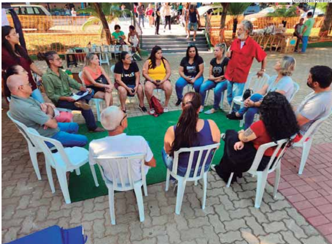
Roda de conversa aconteceu na praça Santa Cruz

"Pessoas com deficiência psicossocial apresentam sequelas de transtornos mentais, mas que não as incapacita de trabalhar e ter uma vida produtiva. O tratamento psicossocial não se limita a quatro paredes. Ele vai, também, para fora. Essas pessoas têm que ser reinseridas na sociedade, estar em evidência no convívio pessoal, participar, em todos os âmbitos. Na casa do paciente, inclusive, a família tem