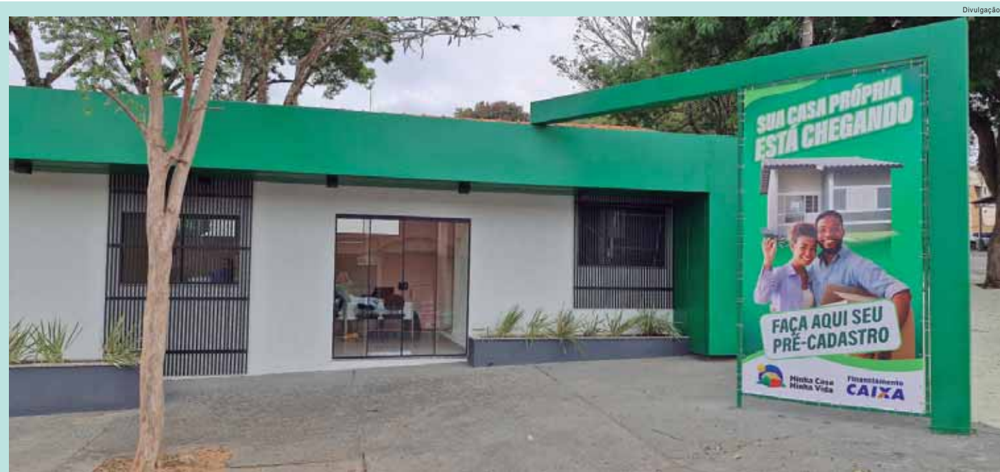
CASAS POPULARES - É o maior programa habitacional voltado à moradia popular de São Pedro; Residencial Monte Verde tem 1.034 lotes disponíveis, em São Pedro. Lançamento hoje, às 10h. A15