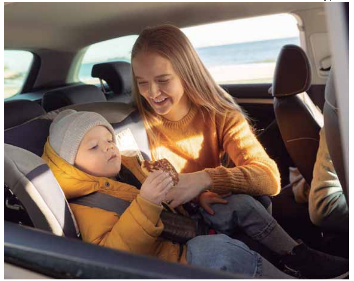
Os acidentes de trânsito são a principal causa de morte entre crianças de 1 a 14 anos no Brasil

Cinto de segurança: Para crianças acima de 10 anos ou com mais de 7 anos e meio com altura acima de 1,45 metro.