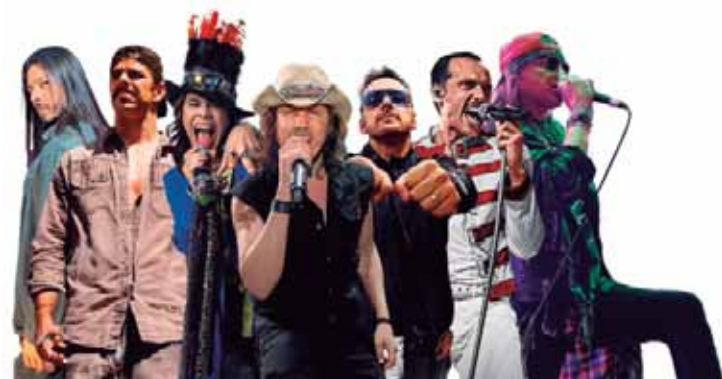
A estância de São Pedro foi escolhida para sediar o maior festival de bandas cover do interior paulista

00h - Guns N' Roses Cover - Use Your Guns @gunscover