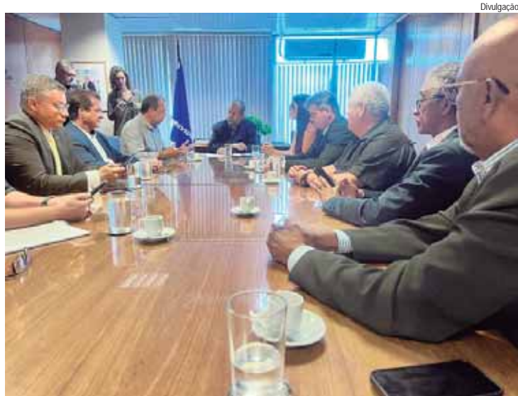
Vicentinho foi recebido no Ministério da Previdência Social pelo ministro Carlos Lupi