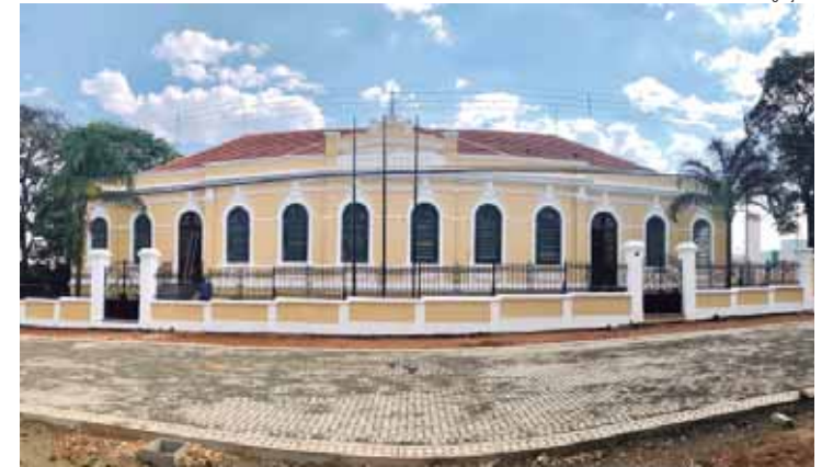
Semana Nacional de Museus vai de 13 a 19 próximos