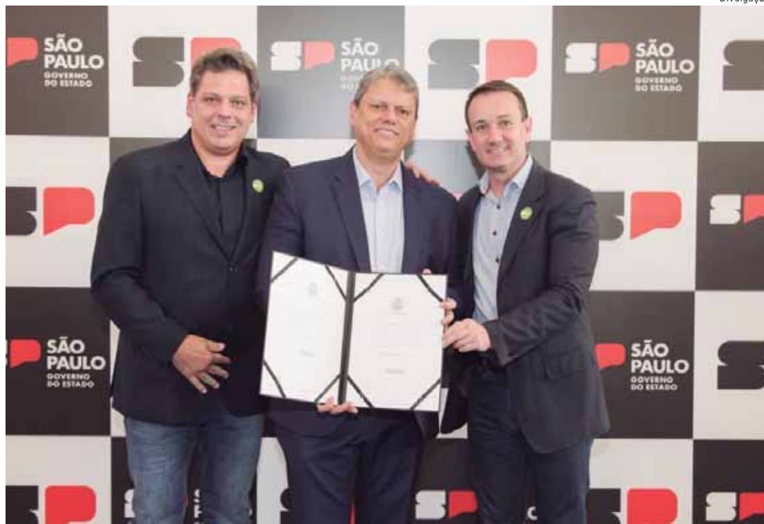
Assinatura dos convênios foi esta semana no Palácio dos Bandeirantes

O CREAS tem como público alvo crianças, adolescentes, jovens, mulheres, pessoas idosas, pessoas com deficiência, e suas famílias, que vivenciam situações de ameaça e violações de direitos por ocorrência de abandono, violência física, psicológica ou sexual, exploração sexual comercial, situação de rua, vivência de trabalho infantil e