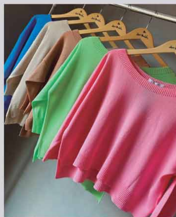
TRICOT ZARA R$149,90