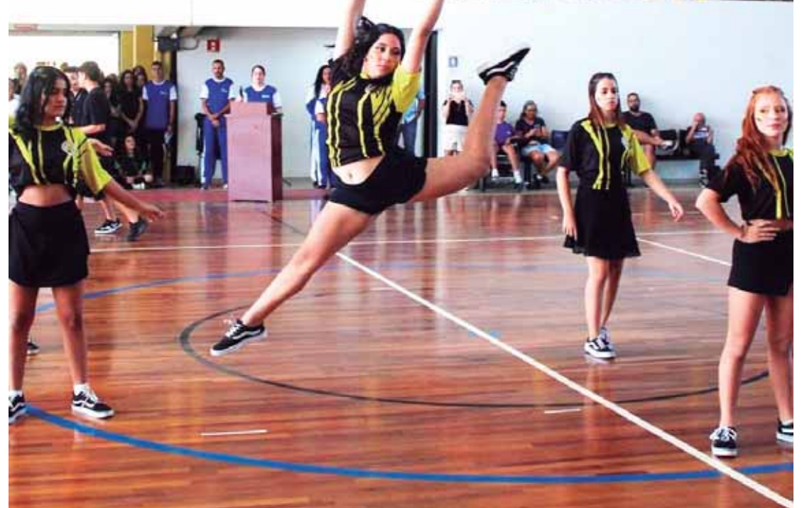
Abertura também contou com apresentação dos alunos