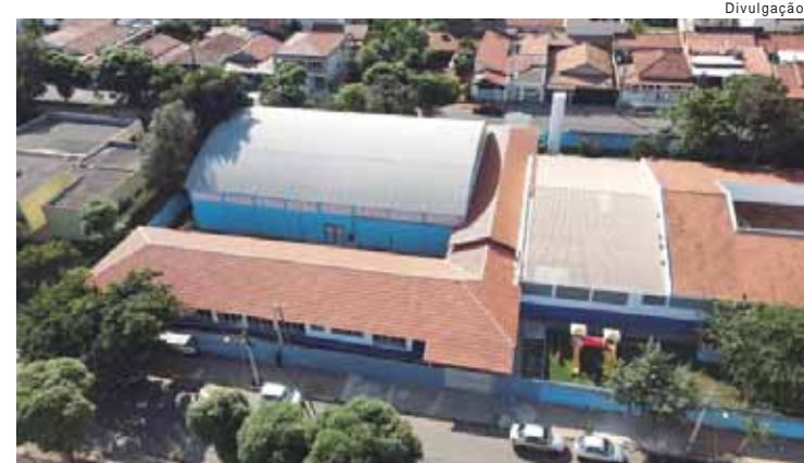
Prefeito Thiago Silva faz neste sábado a inauguração da ampliação da Emeb Guido Dante

"Nosso olhar sempre foi diferenciado para esta escola e as ações foram planejadas com foco no bem estar de todos que utilizam este espaço", disse o prefeito Thiago Silva.