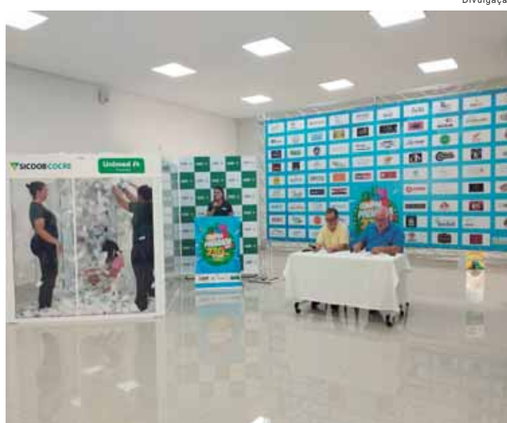
Acontece neste sábado o sorte da Acisp

Ao final da promoção o valor das premiações terá totali-