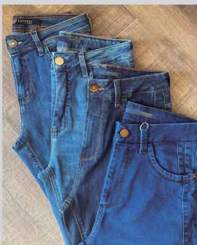
CALÇA JEANS A PARTIR R$259,90