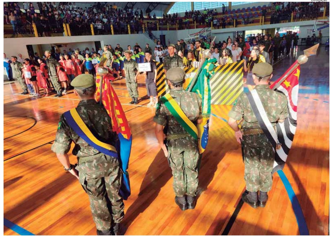
Abertura dos Jogos Interescolares foi realizada no Bordadão

MODALIDADES - Aproximadamente 2 mil alunos participam dos jogos, divididos por categoria. Na categoria B, que reúne os nascidos em 2009, 2010 e 2011, as modalidades são atletismo, basquete, damas, handebol, futsal, futebol society, natação, voleibol, skate, xadrez e tênis de mesa masculino e feminino. Na categoria C, com estudantes nascidos em 2012, 2013 e 2014, as modalidades serão: queimada, voleibol adaptado, basquete gigante, chute ao gol; atletismo e tênis de mesa.