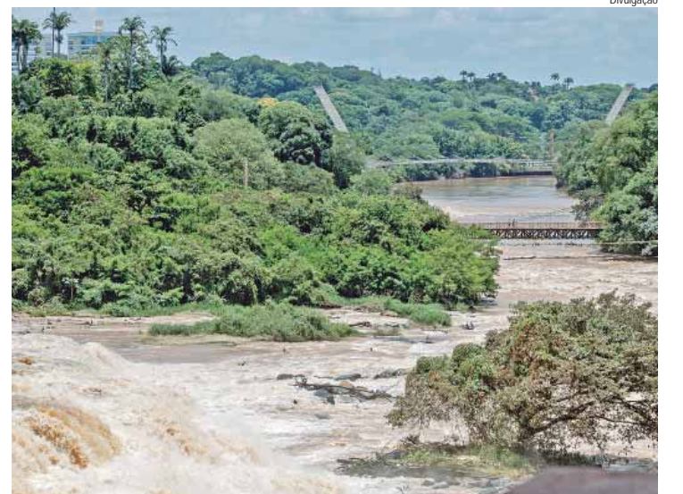
Divulgação Simapira objetiva mobilizar pessoas e fortalecer reflexões e práticas sobre as questões socioambientais locais e globais

As instituições que integram a Simapira 2024 são: Prefeitura, por meio da Secretaria Municipal de Educação (SME), Secretaria de Infraestrutura e Meio Ambiente de Piracicaba (Simap