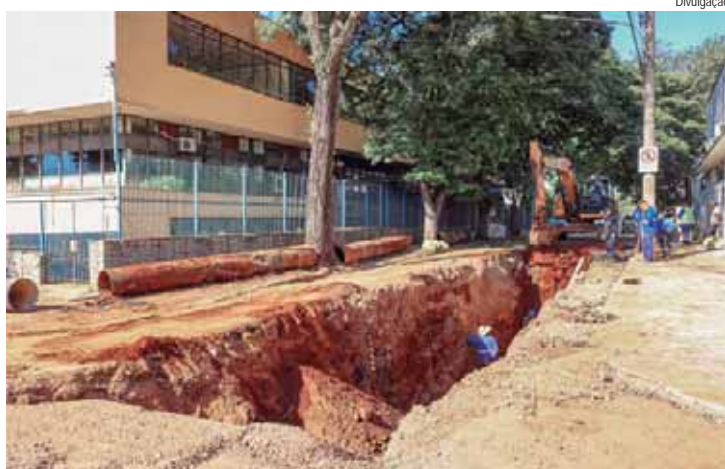
Obra vai beneficiar cerca de 20 bairros abastecidos por trecho da adutora

O Semae (Serviço Municipal de Água e Esgoto) realizou a troca de tubos de parte da adutora que liga a Estação de Tratamento (ETA) Luiz de Queiroz à Estação Elevatória de Água Tratada (EEAT) Marechal Deodoro. A obra teve início na última terça-feira, 21/05, e foi finalizada na manhã de sexta-feira (24). O serviço foi executado para substituir tubos antigos que abastecem a região de ao menos 20 bairros da cidade. O abastecimento já foi retomado normalmente no local da manutenção.