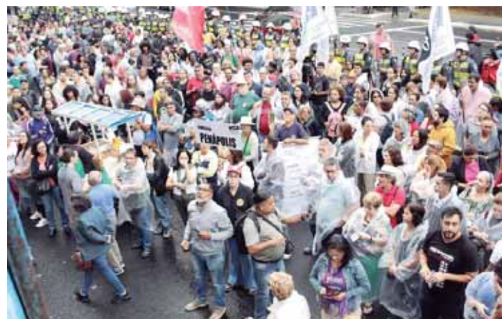
Mesmo debaixo de chuva, professores se reuniram em assembleia e decidiram ampliar a mobilização em todo Estado de São Paulo