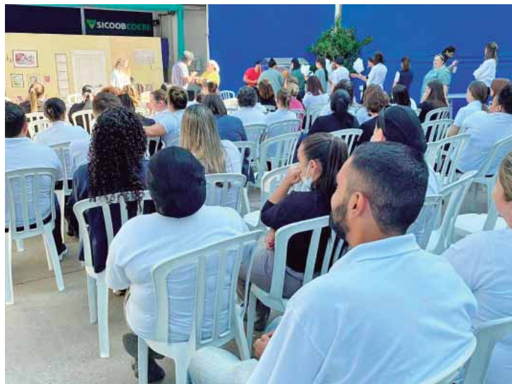
Encontro com palestras para capacitação sempre melhor