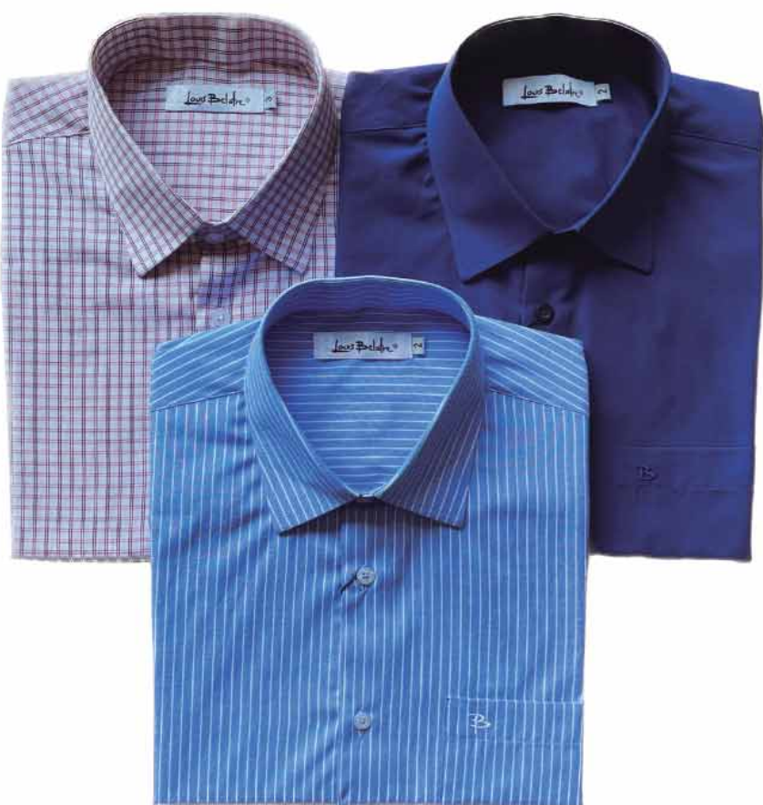
CAMISA MASCULINA BIS MANGA CURTA R$119,90