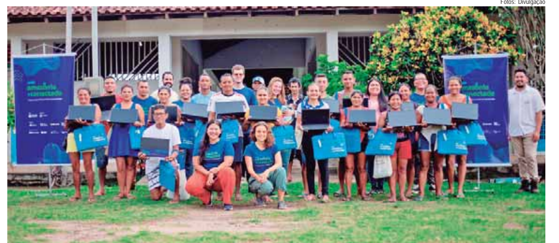
Participantes da Comunidade Terra Preta do Salé

A iniciativa já está rendendo frutos com a participação dos membros das 12 comunidades da primeira fase. Além de adquirirem habilidades no uso de computadores e ferramentas online, os participantes têm a oportunidade de se inscrever em cursos profissionalizantes, como aulas de inglês