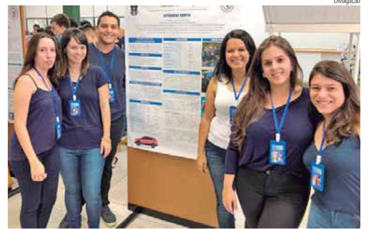
Os melhores trabalhos, desde 2019, podem ser acessados pelo portal da Fumep

A coordenação do curso de Engenharia de Produção, da Escola de Engenharia de Piracicaba (EEP), uma das unidades educacionais da Fundação Municipal de Ensino de Piracicaba (Fumep), vai promover no dia 6/6 a abertura da 10ª edição da Jornada de Estudos, com a apresentação de alguns trabalhos selecionados no primeiro semestre de 2024.