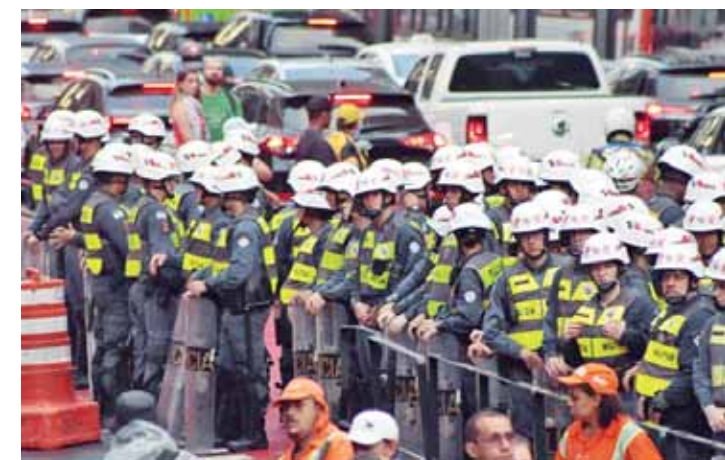
Um forte aparato policial foi montado para acompanhar a assembleia dos professores, o que foi motivo de críticas por parte da Apeoesp