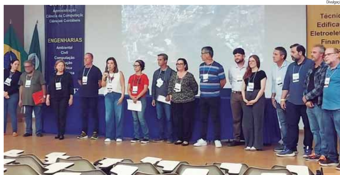
Evento promovido pela Prefeitura aconteceu neste sábado (25) na Fumep

ações, a Conferência também elegeu delegados para representar Piracicaba na Conferência Estadual e selecionou membros da so-