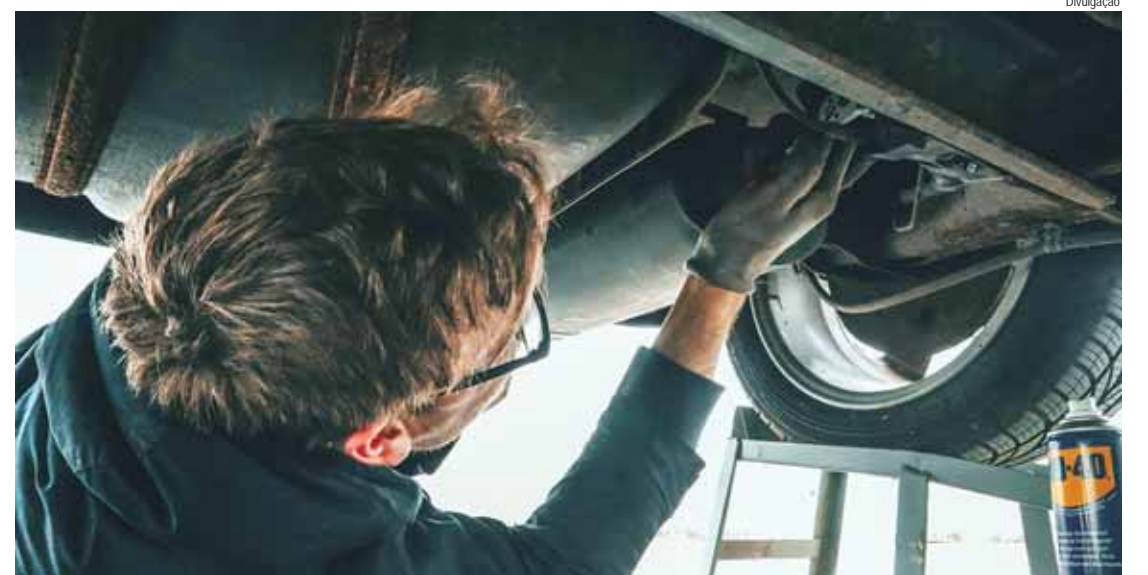
Cursos profissionalizantes na área automotiva têm inscrições abertas pela Semdettur

REQUISITOS – Podem se inscrever candidatos com o ensino