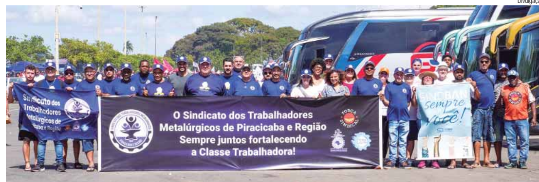
Manifestação em Brasília aconteceu dia 22, em Brasília

Reconstrução do estado do Rio Grande do Sul e medidas de prote-