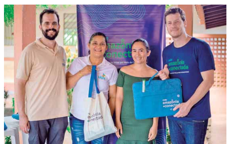
Entregas de computadores e internet para comunidade

SOBRE A USAID - A Agência dos Estados Unidos para o Desenvolvimento Internacional (USAID) é uma das principais agências de desenvolvimento do mundo, desempenhando um papel fundamental como ator catalisador, buscando impulsionar resultados significativos. Seu trabalho é dedicado a melhorar vidas,