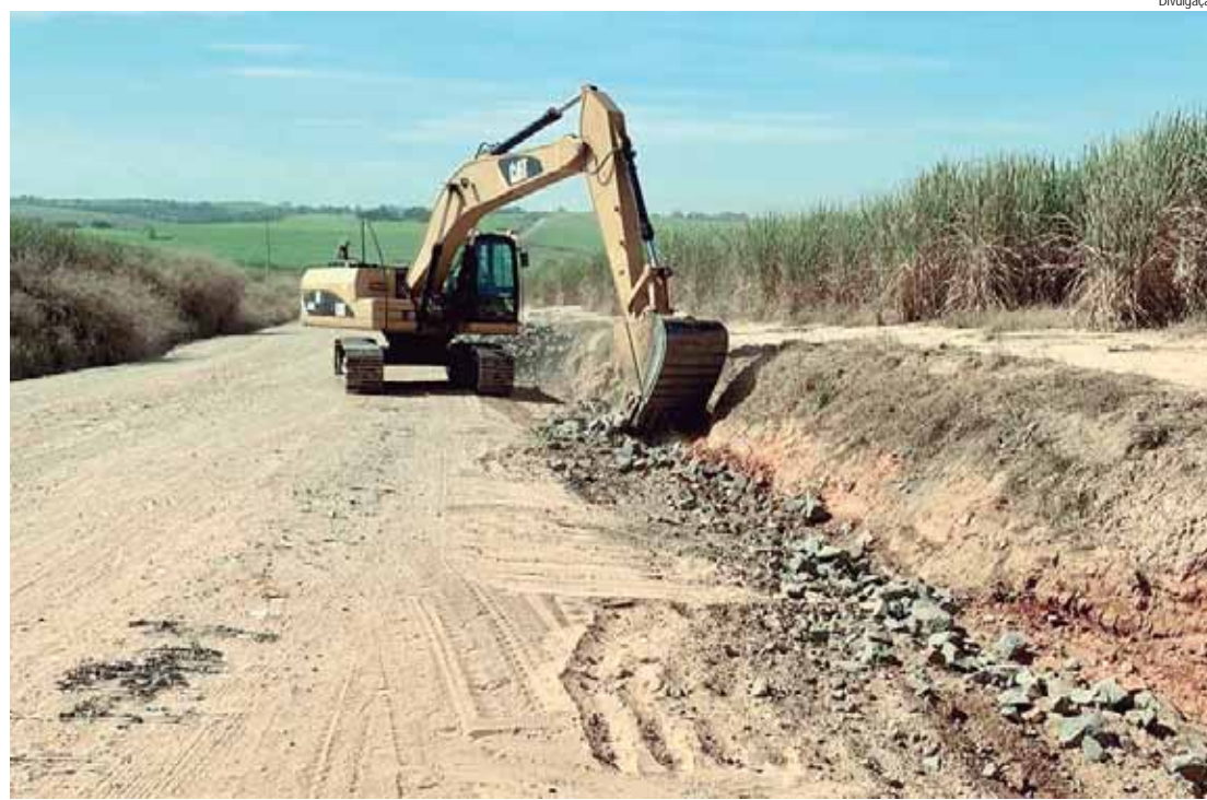
Manutenção em valeta na PIR 290: foram atendidos os bairros Conceição, Ibitiruna, Paredão Vermelho, Morro Preto, Floresta, Bangê, Pau D'Alinho, Serrote, Jiboia e Anhumas

Durante todo o período de reconstrução, a população não foi