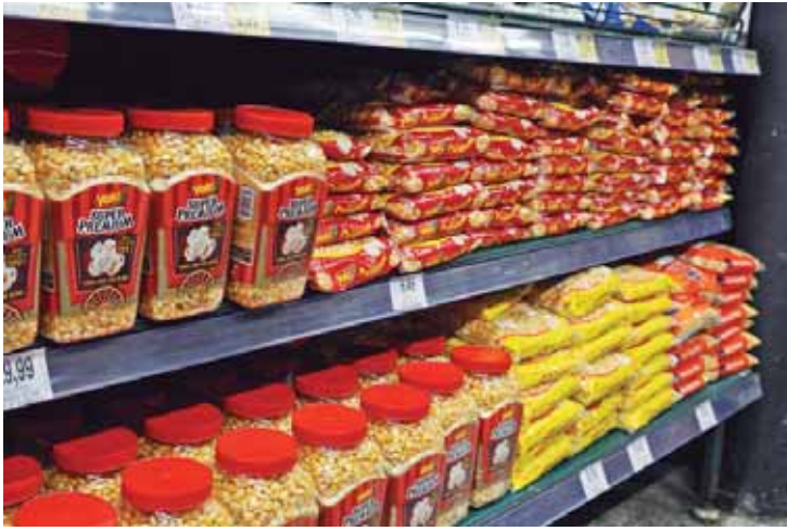
Produtos utilizados nas festas juninas estarão na mira dos agentes do Procon