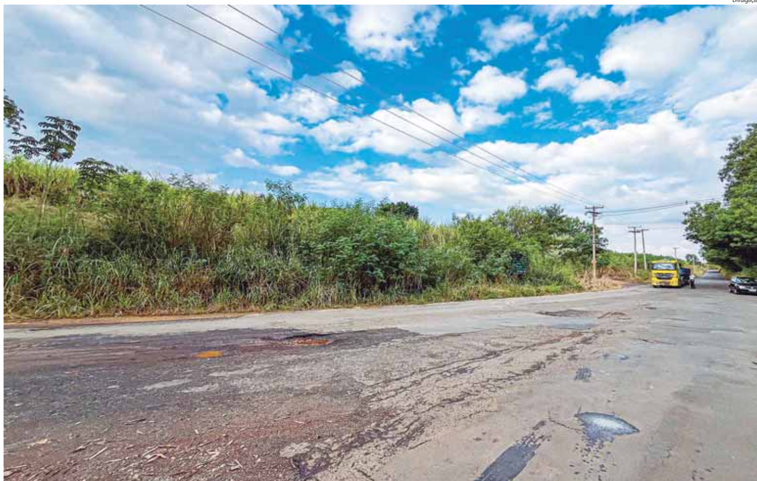
Todo trecho será feito em concreto, em uma extensão de 4,1 km