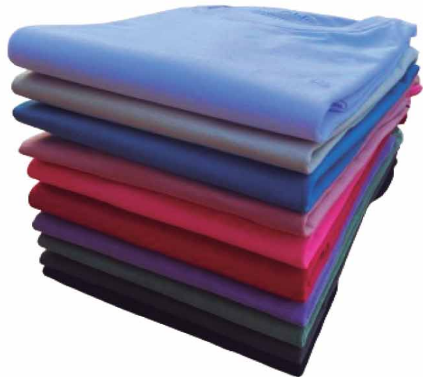
CAMISETA MASCULINA R$79,90