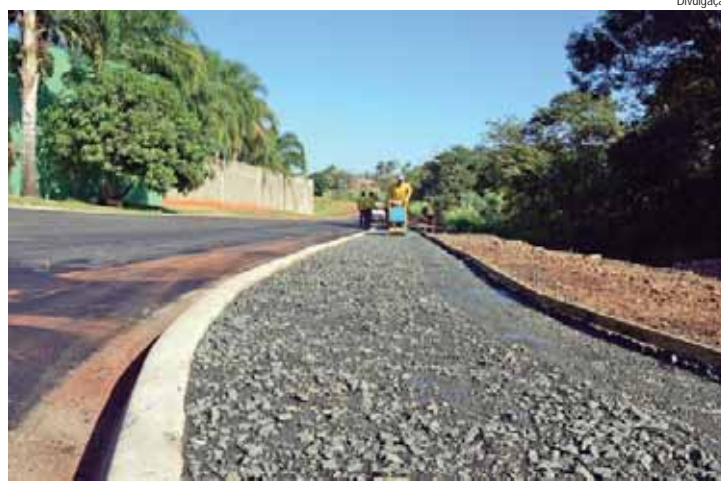
Rua José Abdalla está recebendo novas calçadas

Os serviços visam melhorar a integração das vias no bairro, aprimorando a mobilidade urbana, já que os trechos ainda não são pavimentados. O investimento total das obras é de R$ 1.879.000,00.