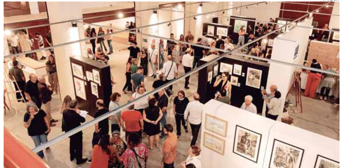
Inauguração da Nova Pinacoteca recebeu cerca de 400 pessoas

PRIMEIRAS IMPRESSÕES — Nesta semana, um grupo de alunos do 7º ano da Escola Estadual Jerônimo Gallo conhe-