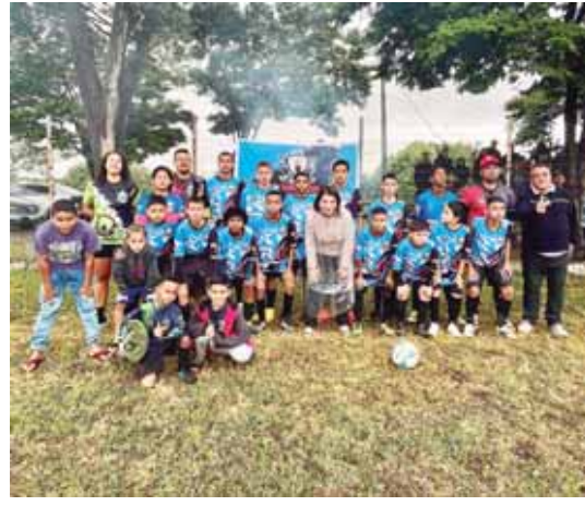
Bebel com os meninos que integram o time do Poderoso FC e que estão na final da Superliga