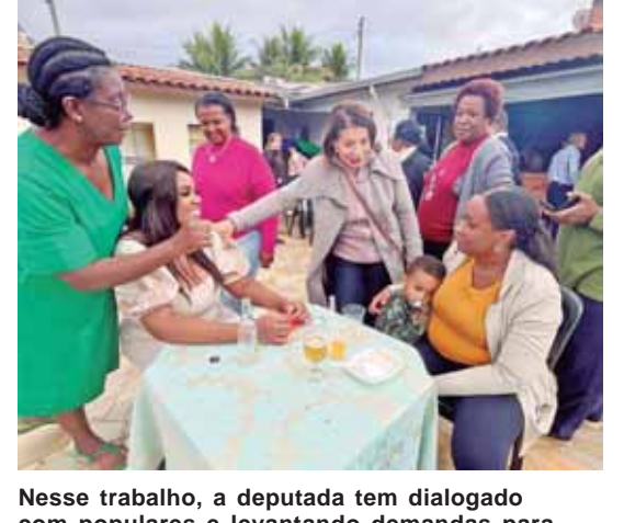
Nesse trabalho, a deputada tem dialogado com populares e levantando demandas para fazerem parte do seu programa de governo