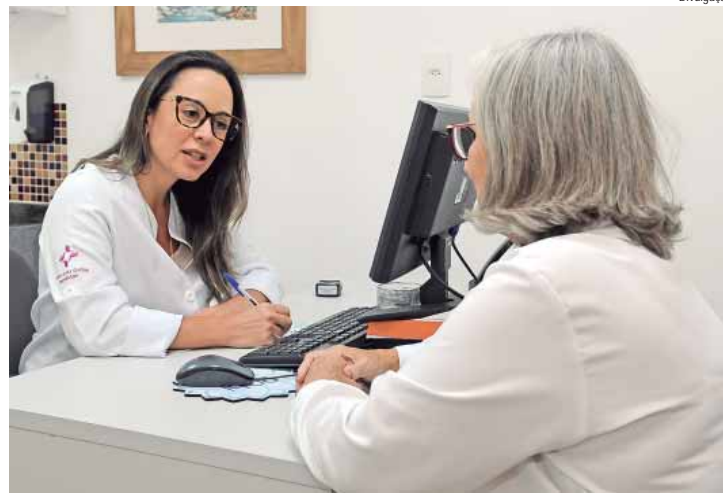
Profissional do Santa Casa Saúde em acompanhamento a beneficiária hipertensa e diabética, condições que afetam muitas mulheres

Na operadora Santa Casa Saúde, há ainda um programa de acompanhamento a candidatas à cirurgia bariátrica. "Oferecemos equipe multidisciplinar para suporte antes e após a cirurgia, essencial para mulheres que enfrentam problemas relacionados à obesidade, de forma a auxiliar na recuperação e na manutenção de