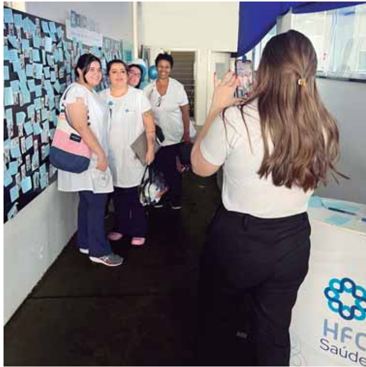
Várias atividades foram desenvolvidas durante a Semana