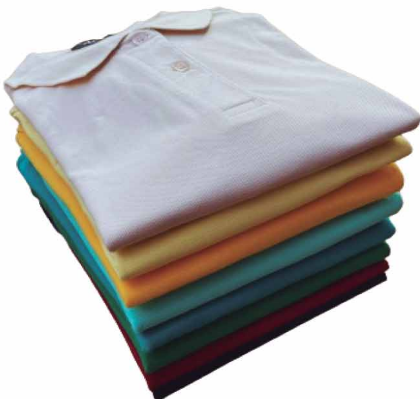
POLO MASCULINA R$99,90