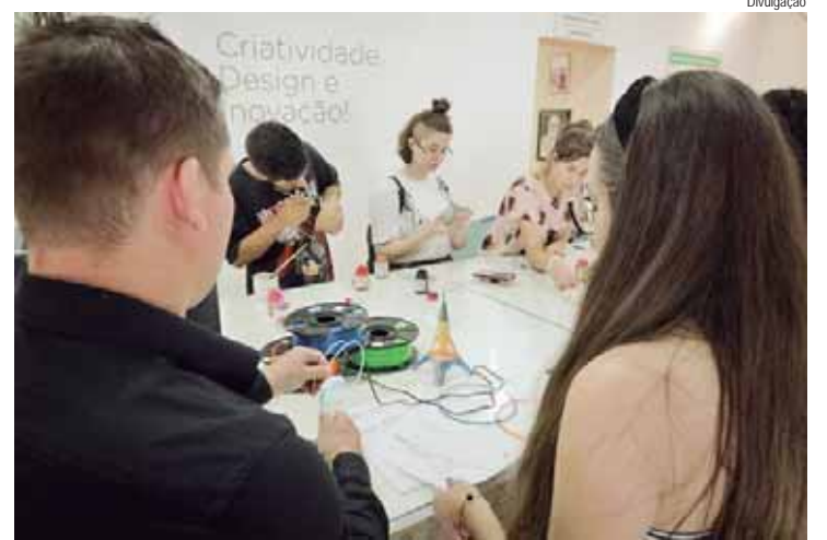
As inscrições encerram-se amanhã, 29

Também atuou como diretor jurídico da Câmara Municipal de Charqueada em 2014, como assessor jurídico no Serviço Autônomo de Água e Esgoto de Rio das Pedras entre 2014 e 2015, como assessor jurídico em Rio das Pedras em 2015, como professor na Faculdade Anhanguera de Santa Bárbara D'Oeste de 2017 a 2019 e como advogado e responsável pelo jurídico do Grupo OSS em São Pedro.