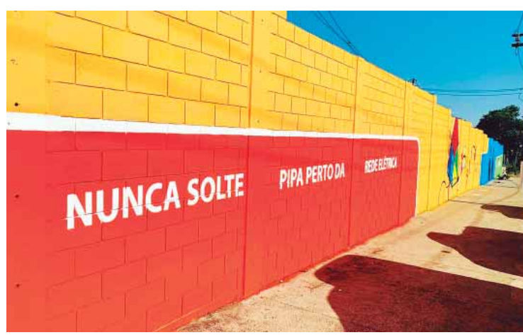
Grafite em muro da Subestação Quilombo, na cidade de Sumaré, feito por Leandro Kranium

Passeio Histórico no Engenho Central. Domingo (2), às 8h. Participação gratuita. Vagas limitadas. Inscrições a partir de amanhã (29), às 10h, pelo site https://doity.com.br/passeio-historico-engenho-central-de-piracicaba-224815-20240527112119 .