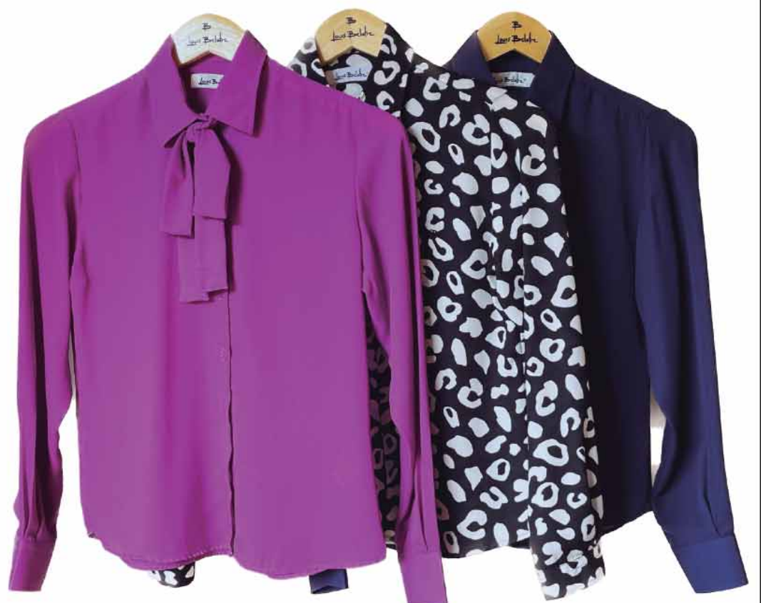
CAMISA FEMININA R$79,90

*VALORES ATÉ O TAMANHO 6 E GG. CONSULTE VALOR TAMANHO ESPECIAL