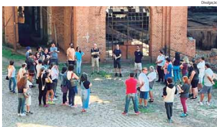
O passeio também vai falar como a atividade no Engenho Central com a cana-de-açúcar

A Prefeitura, por meio da Semac (Secretaria Municipal de Ação Cultural) e do Misp (Museu da Imagem e Som de Piracicaba), promovem a quarta edição do passeio histórico no Engenho Central neste domingo (2), às 8h, com participação gratuita da população. As três primeiras edições, realizadas em janeiro, março e abril deste ano, atraíram cerca de 50 participantes em cada uma.