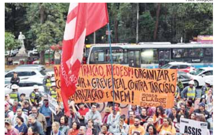
Na assembleia, professores criticam aos ataques do governador Tarcísio de Freitas contra a categoria