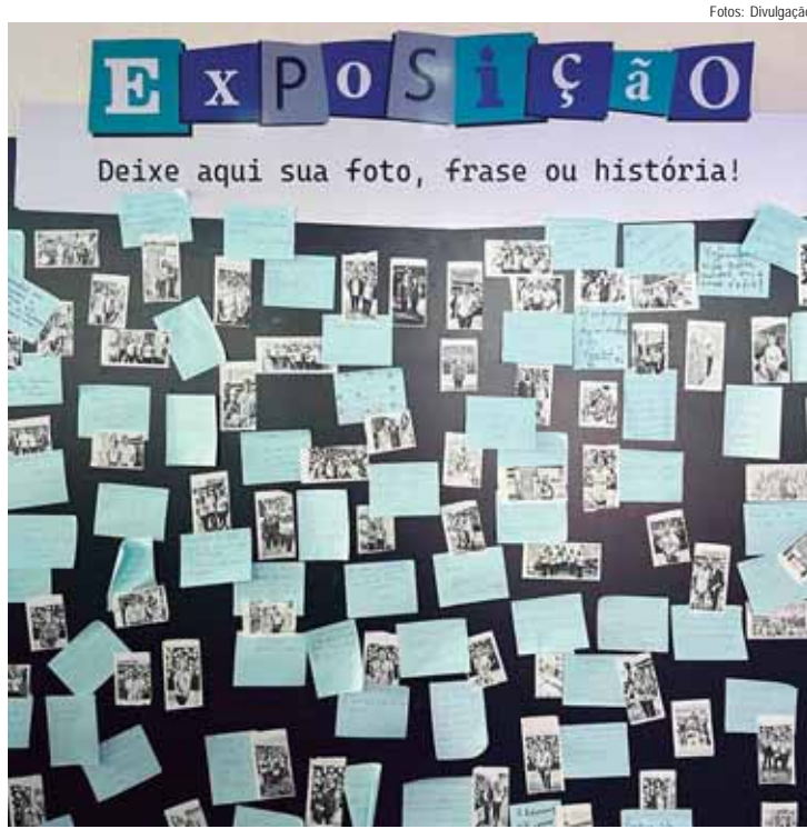
Destaques aos profissionais que atuam na área