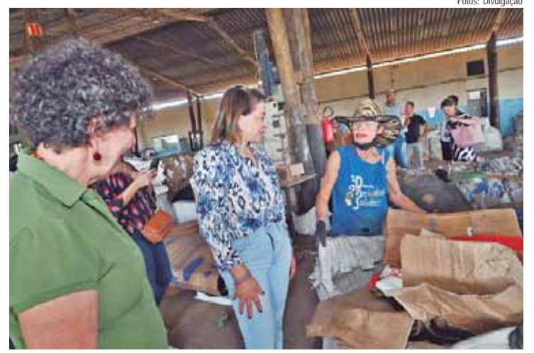
Bebel destacou a importância do trabalho da cooperativa de reciclagem, contribuindo para preservação do meio ambiente