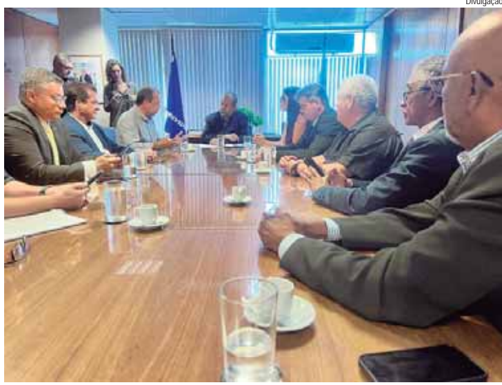
Vicentinho foi recebido no Ministério da Previdência Social pelo ministro Carlos Lupi