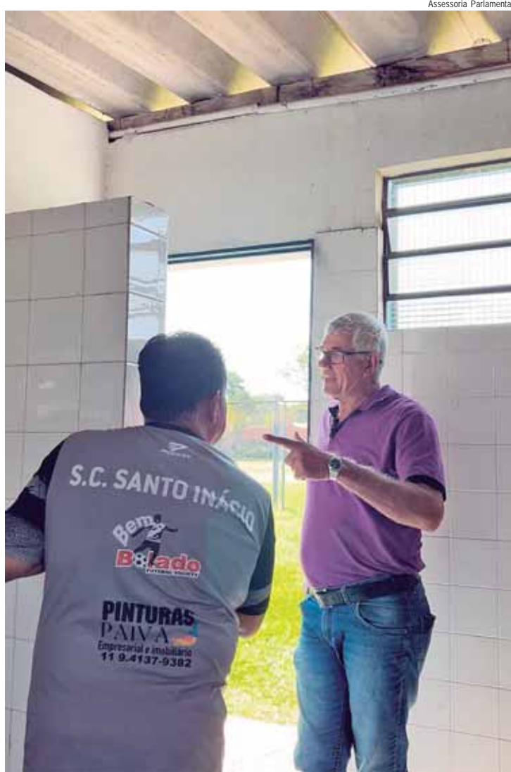
Visita teve como objetivo verificar o andamento dos trabalhos