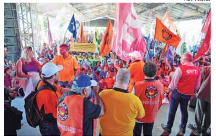
A plenária, organizada pelas centrais sindicais, foi marcada por ampla discussões e pela aprovação de uma pauta entregue ao governo federal e ao Congresso Nacional

As centrais sindicais também exigem a retirada do Projeto de Emenda Constitucional (PEC) 32, a chamada Reforma Administrativa, da pauta do Congresso. Apresentada pelo ex-presidente Jair Bolsonaro, a PEC é considerada um "ataque que pretende destruir os serviços públicos, privatizar o que for possível e piorar