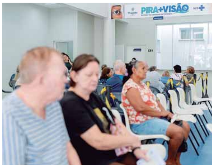
Pira+Visão é uma das ações que agora poderá receber aporte de emendas parlamentares por meio do Cismetro

A Prefeitura de Piracicaba ganha novo reforço para oferta de atendimento em saúde à população por meio do Cismetro (Consórcio Intermunicipal de Saúde) com a aprovação do projeto de lei nº 94/2024, pela Câmara Municipal, na última segunda-feira, 20/05. Com isso, agora a Secretaria Municipal de Saúde pode criar projetos e ações e incluir recursos advindos de emendas parlamentares no rol daqueles utilizados para o pagamento dos serviços de saúde contratados por meio do consórcio, conforme rege a Lei Municipal 10.013/2023.