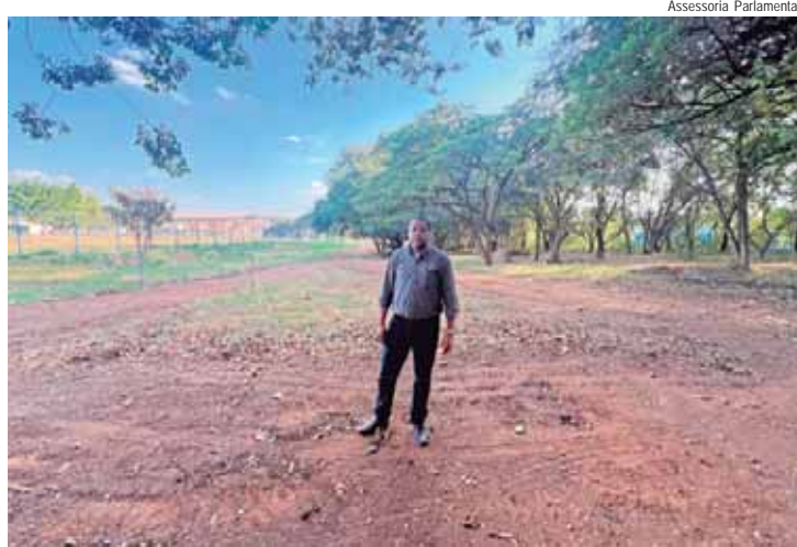
Pedidos de melhorias foram objeto das indicações 2253/2021, 2254/2021 e 3757/2021, de autoria do vereador Thiago Ribeiro