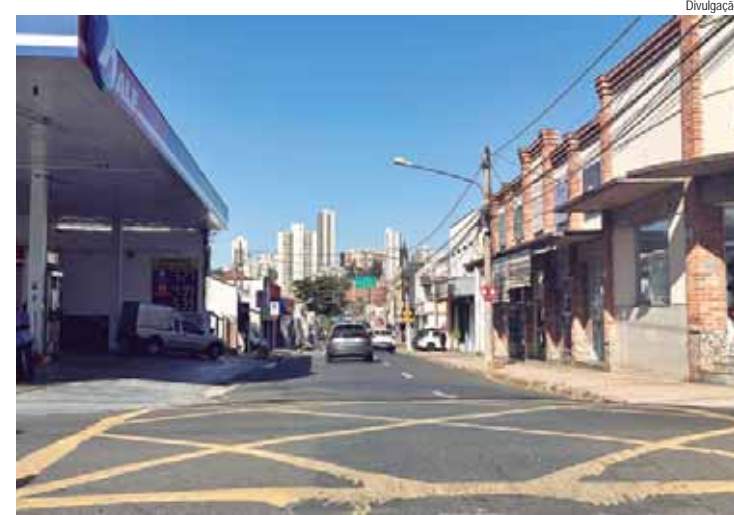
No período da tarde, os serviços continuarão no trecho da rua Boa Morte até a avenida Armando de Salles Oliveira

PRÊMIO - O concurso faz parte da 3ª edição do Fórum Diálogos na Educação, evento online com transmissão ao vivo que será realizado hoje, 23/05. Neste ano, o tema escolhido foi: Ser e Pertencer no Ambiente Escolar. Uma equipe da emissora EPTV, afiliada à TV Globo, sediada em Campinas, esteve na escola para gravar entrevistas com os educadores envolvidos e famílias que participaram do projeto.