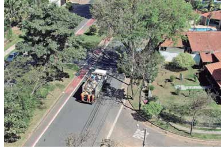
Plataforma será para cadastro de condomínios e empresas que geram até 200 litros por dia de recicláveis