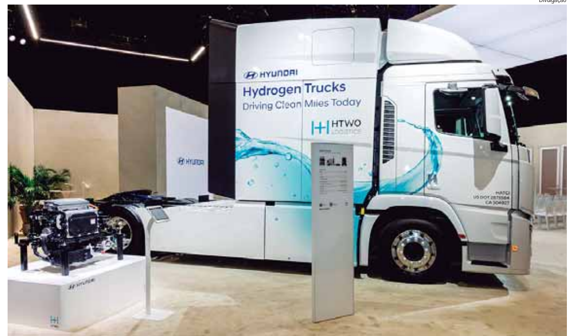
Empresa exibe o caminhão XCIENT Fuel Cell e o sistema de célula de combustível a hidrogênio

No início deste ano, a Hyundai Motor anunciou sua visão para a expansão da marca HTWO na cadeia de valor do hidrogênio, o que sinalizou que esta será a catalisadora para uma transição energética global. A empresa pretende concretizar a sua visão para uma sociedade baseada no hidrogênio, e alavancar as capacidades integradas do Grupo em várias indústrias.