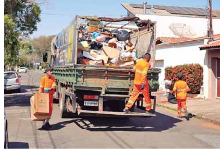
Cadastro tem objetivo de disciplinar o sistema de coleta seletiva, evitando descarte irregular