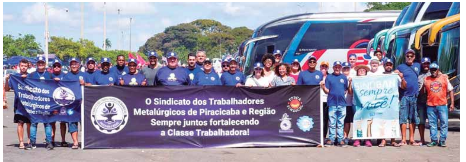
Trabalhadores de Piracicaba estiveram em Brasília, ajudando a engrossar a Marcha em defesa da classe trabalhadora

desvinculação das receitas da Educação e da Saúde, por reajuste salarial digno aos servidores, pela reestruturação de carreiras e realização de concursos públicos, pelo piso da educação, pelo piso da Enfermagem, pelo fim da contribuição de aposentados para a Previdência e pelo descongelamento do tempo de serviço da pandemia.