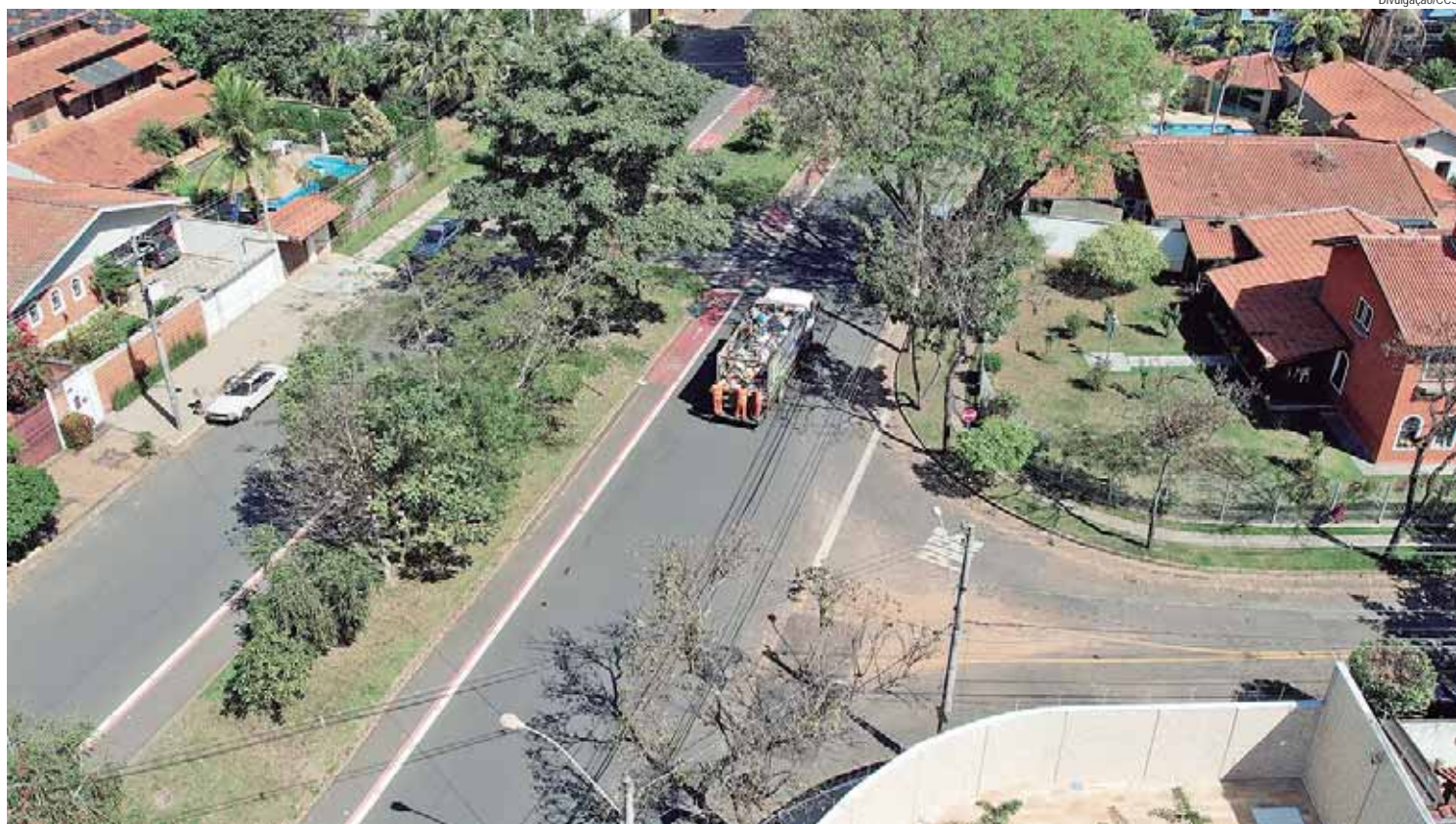
Plataforma será para cadastro de condomínios e empresas que geram até 200 litros por dia de recicláveis