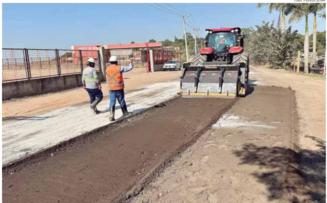
Estabilizante começou a ser aplicado nesta segunda-feira (20)