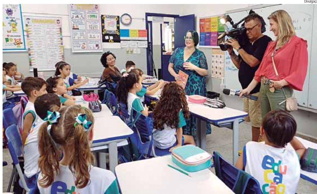
Uma equipe da emissora EPTV, afiliada à TV Globo sediada em Campinas, esteve na escola para gravar entrevistas com os educadores envolvidos

Uma das etapas envolve levar bonecos de diversos tons de pele para a sala, todos sem olhos, boca e cabelo. Os estudantes escolhem um boneco para representar a si mesmos e o levam para casa, onde dialogam com suas famílias sobre suas características e histórias de vida, completando o boneco com olhos, boca, cabelo, roupas e acessórios. Depois, apresentam o boneco e sua história à turma. Um relatório fi-