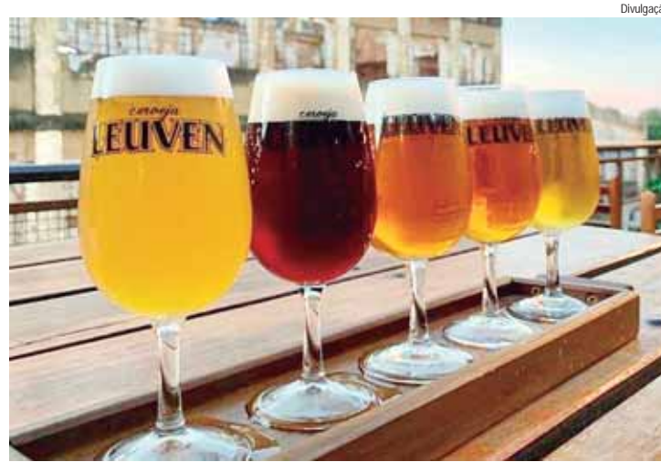
O tour é uma experiência pelas cervejarias artesanais da cidade

O apoio é do Arranjo Produtivo Local de Máquinas Equipamentos e Serviços Industriais para Cervejarias (APLCerva), do Simespi.