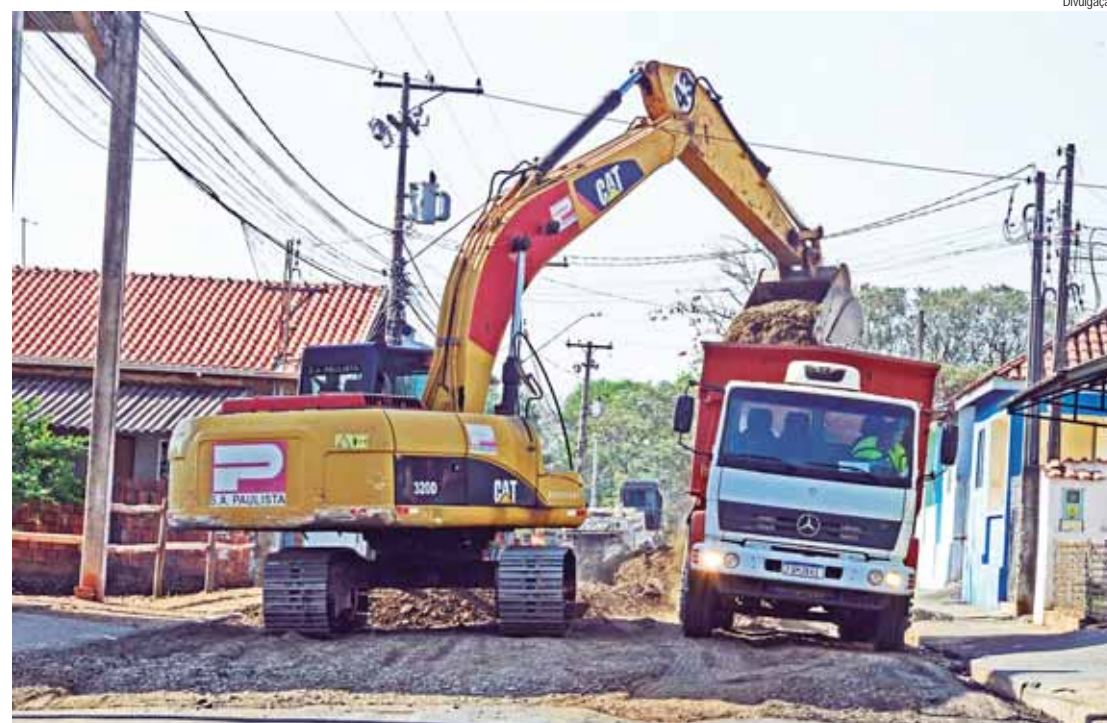
Via será atendida com novo pavimento da avenida Aristides Antonio Scarpari até a rodovia Geraldo de Barros

O pavimento de concreto é vantajoso porque tem alta durabilidade, já que o PUC (Pavimento Urbano em Concreto) tem garantia de, no mínimo, 20 anos contra danos causados pelos impactos no pavimento, tonando-se uma alter-