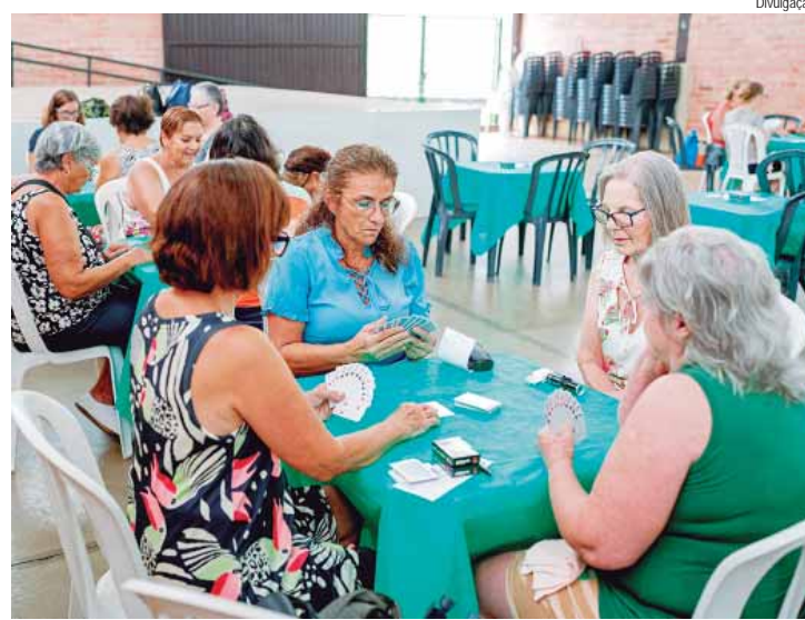
Terceiro Vem Jogar promove os jogos de cartas

SERVIÇO Vem Jogar – Terceira edição, segunda-feira (27), a partir das 13h30, no Salão de Festas do Lar dos Velinhos. Avenida Torquato da Silva Leitão, 615, no São Dimas. Mais informações pelo telefone da Selam (19) 3403-2648.