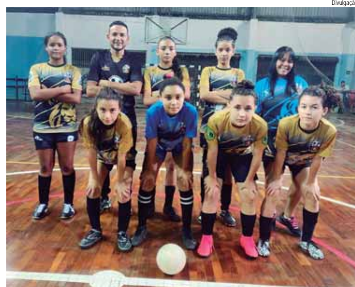
Elenco feminino do Vila Nova faz sua estreia no torneio de futsal dos Jogos Comunitários

Por fim, na Pádua Dias, as obras acontecem no trecho entre a rua Bela Vista até o acesso à avenida Alberto Vollet Sachs. Por isso, a faixa da esquerda, no sentido Piracicaba-Americana, bem como no sentido Americana-Piracicaba, estão interditadas para o desenvolvimento dos serviços de drenagem e pavimentação de concreto. Todos os serviços integram o pacote de revitalização da malha asfáltica, que vai beneficiar 258 km de vias do município com pavimento em concreto e asfalto.