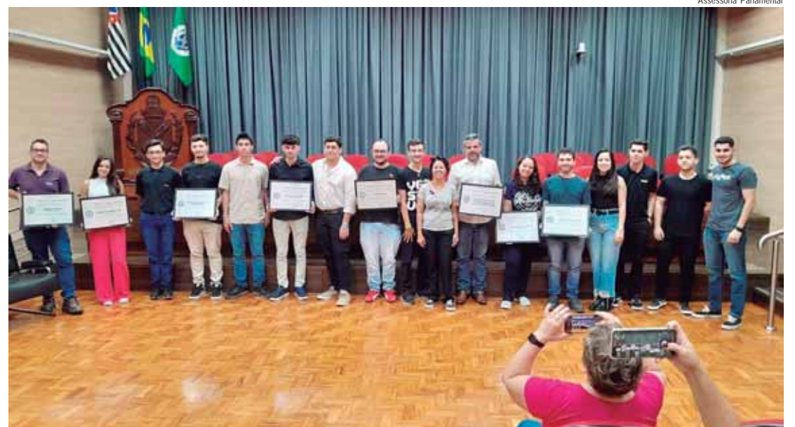
Entrega dos votos de congratulações foram entregues em cerimônia nesta segunda-feira (20), no Salão Nobre "Helly de Campos Melges"