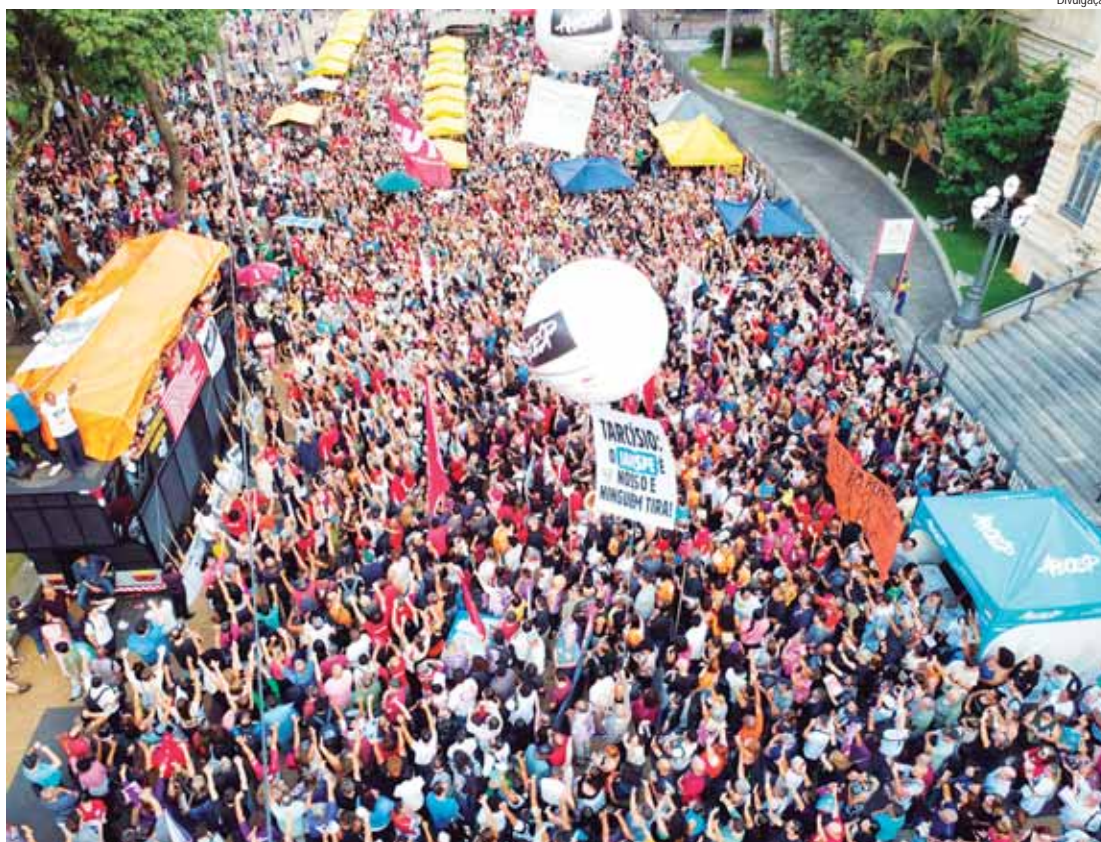
Assembleia no último dia 26 de abril reuniu mais de 10 mil professores de diversas regiões do Estado

Na pauta da assembleia estão a luta contra o fim do autoritarismo e assédio moral, contra o corte