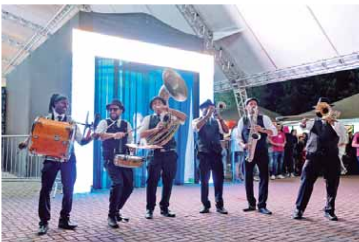
Festa das Nações celebrou solidariedade, compartilhou alegria, ofereceu cultura e muita comida boa