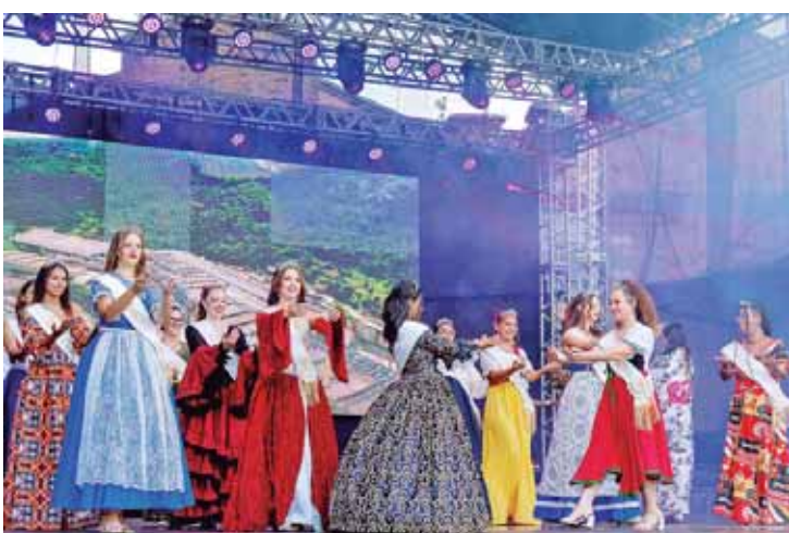
Rainhas da festa se apresentaram ontem, na cerimônia de encerramento