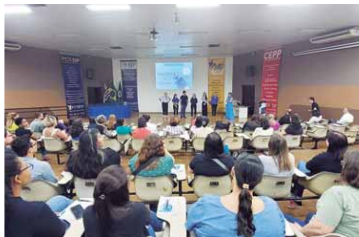
Secretaria de Saúde reuniu mais de 200 profissionais da rede pública em ciclo de palestras alusivo ao Dia da Enfermagem