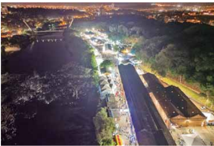
Cerca de 76 mil visitantes passaram pelo Engenho Central durante os cinco dias de festa