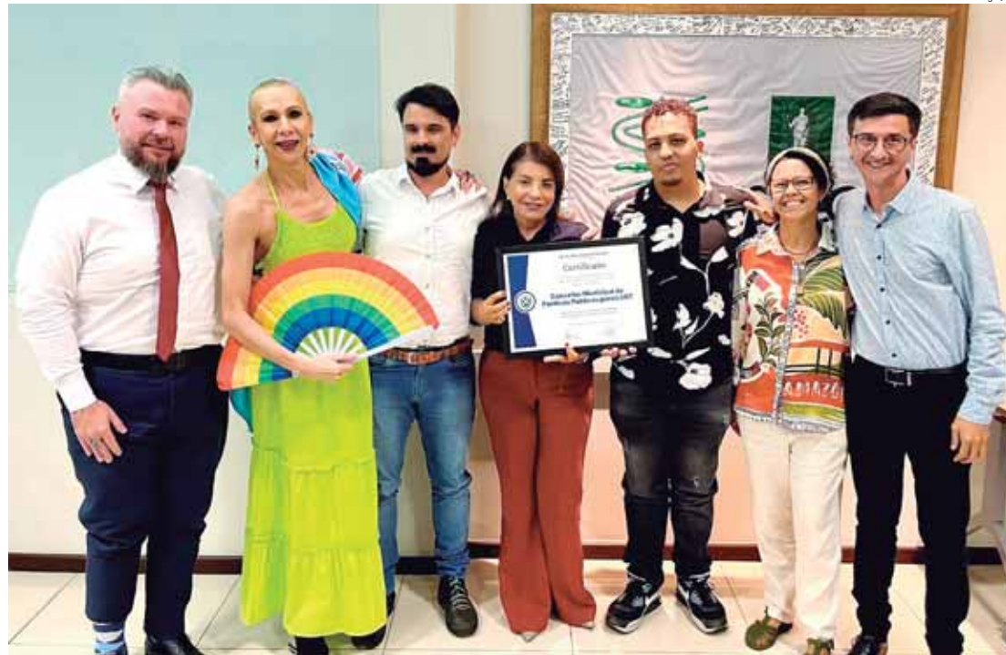
Evento foi realizado no Pavilhão de Administração e Economia da Esalq/USP