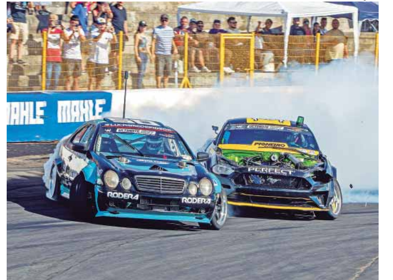
Dayball Diorio Bernardo

PATROCINADORES — Perfect Automotive, PneuStore, Fueltech, Mahle, Menzoi, SKY Automotive, NGK e Barbarius World, com apoio da CBA (Confederação Brasileira de Automobilismo).