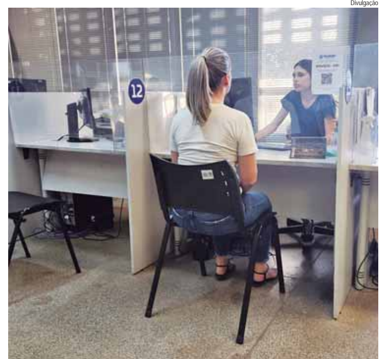
Mutirão para ajudar MEIs com a DASN acontece no Atendimento da Semdettur do Térreo I do Centro Cívico

É importante frisar que a LCSO inclui ações já antes realizadas com exímio e competência como os Grupos Terapêuticos realizados pela Equipe da CPAN, o Programa Piracicaba com Saúde, realizado em parceria com a Secretaria de Educação, que tem como objetivo a promoção da alimentação adequada e saudável e a prevenção da obesidade infantil.