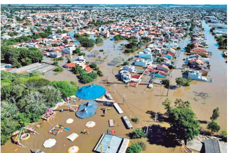
Canoas, RS