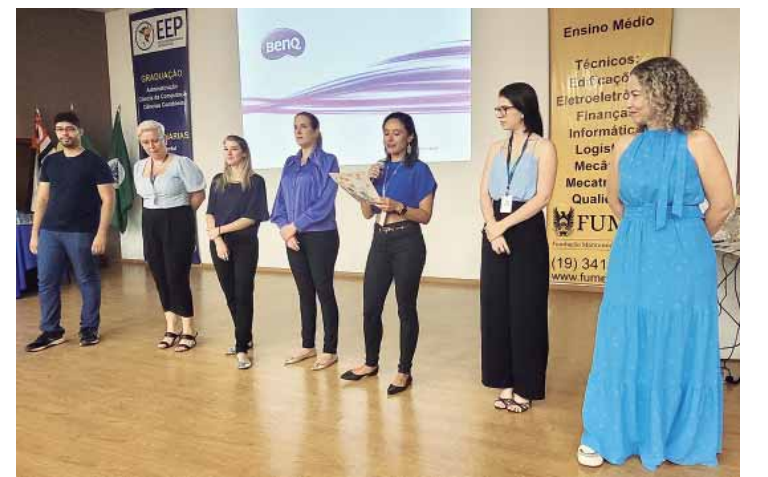
Equipe da Atenção Básica da Secretaria da Saúde da organização evento realizado na Fundação Municipal de Ensino (Fumep)