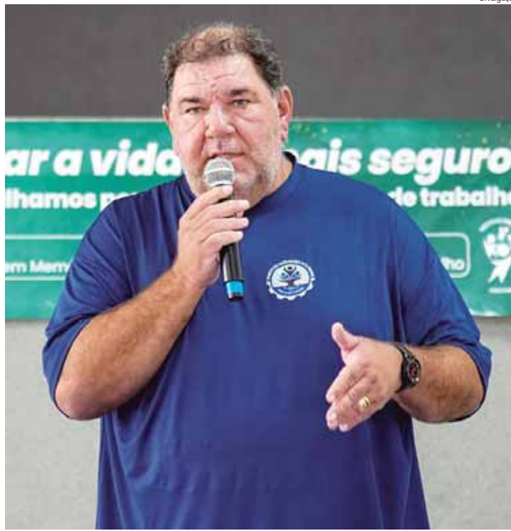
Juca diz que o objetivo do Instituto Sindical é de ajudar a engrossar esta manifestação nacional que visa garantir e reestabelecer direito dos trabalhadores

O presidente do Instituto Sindical diz que na pauta das centrais sindicais que será levada ao governo Lula e ao Congresso Nacional estão: Pela regulamentação da Convenção 151, que garante aos servidores o direito à negociação coletiva, contra a