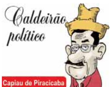
Capiaru de Piracicaba

todos os preparativos, comemoram o encerramento de mais um encontro da solidariedade. A5