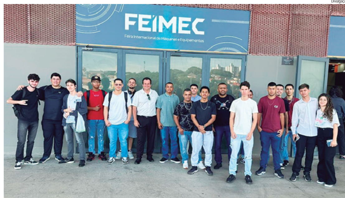
Quarenta alunos do Cotip estiveram no evento no último dia 11 de maio