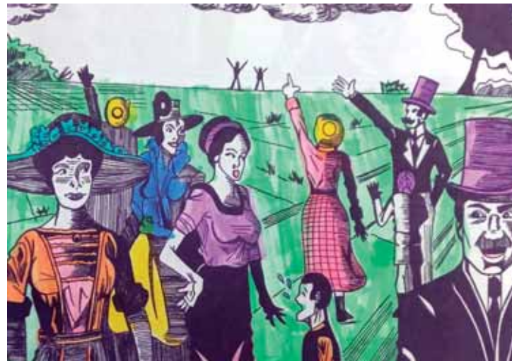
Uma das páginas do livro colorida por um dos alunos presentes