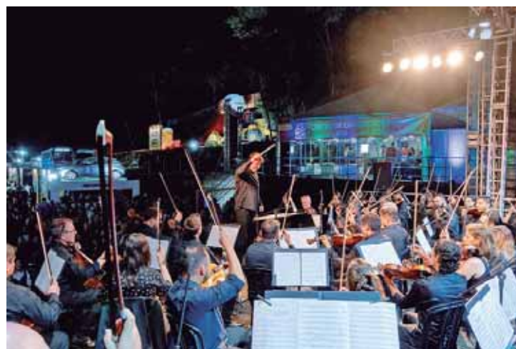
Foram mais de 20 atrações artísticas no palco principal, incluindo a Orquestra Sinfônica de Piracicaba