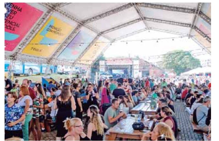
Toda renda gerada na festa será revertida para as 19 entidades participantes neste ano