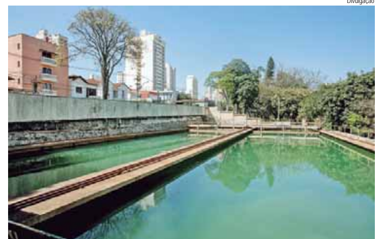
Parte da tubulação antiga da ETA Luiz de Queiroz para EEAT Marechal será substituída

O Semae (Serviço Municipal de Água e Esgoto) vai realizar a troca de tubos em trechos da adutora que liga a Estação de Tratamento (ETA) Luiz de Queiroz à Estação Elevatória de Água Tratada (EEAT) Marechal Deodoro. A manutenção acontece para substituir os tubos antigos que abastecem a região de ao menos 20 bairros da cidade. O serviço terá início hoje (21), até a quarta-feira (23).