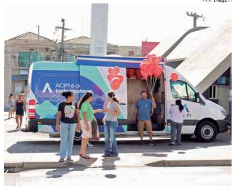
Piracicamirim, Vila Rezende, Paulista e Centro com distribuição de balões