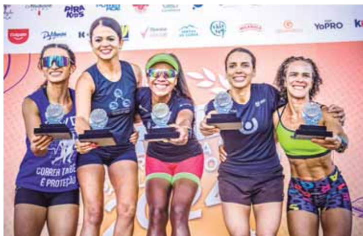
Valinhos pódio 5k Feminino