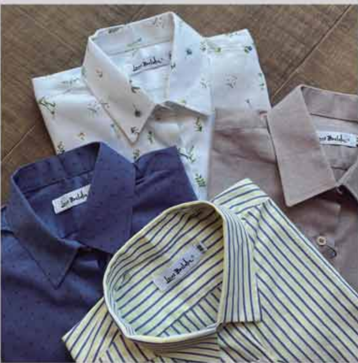
CAMISA M/L R$219,90