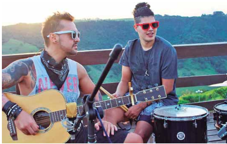
Dupla apresentará clássicos do pop e do rock em versões exclusivas

A dupla, na ativa desde 2019, toca pop e rock e os músicos se dedicam na elaboração de composições e arranjos de alta qualidade, agregando ao repertório diversas músicas vibrantes e conhecidas do grande público. "O projeto consiste em trazer