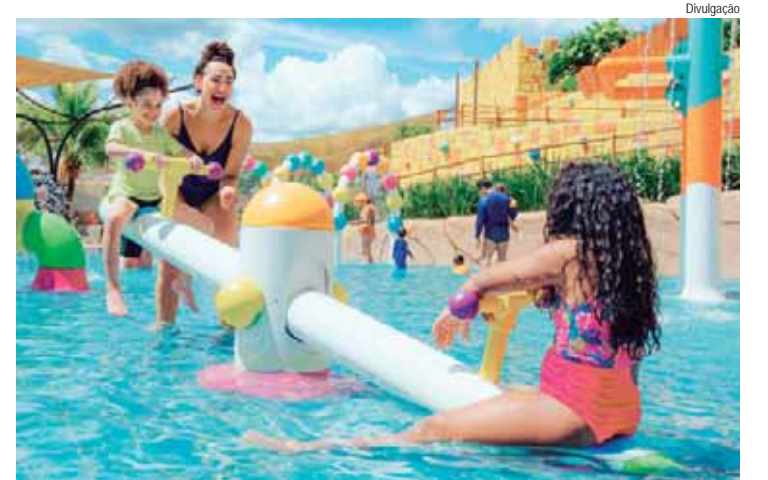
Há opções para brinquedos em todos os cantos do Parque

Que tal criar momentos inesquecíveis ao lado da mãe neste próximo Dia das Mães de uma forma diferente? Com programação especial, o Thermas Water Park São Pedro, um dos parques aquáticos mais completos do país, é o local ideal para essa comemoração.