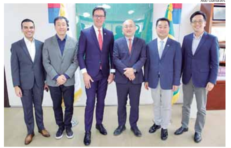
Neste mês, Alesp lançará Frente Parlamentar São Paulo & Coreia

Ao longo dos próximos dois anos serão realizados cursos livres, treinamentos, projetos de extensão e atendimentos todos focados no desenvolvimento da Saúde Digital no Brasil. Para isso, a estrutura terá como apoio uma Unidade Móvel de Saúde, carreta adaptada com consultórios médicos e equipamentos de ponta, além de uma sala de apoio. O Living Lab também contará com uma Sala Philips Foundation, em homenagem à organização sem fins lucrativos holandesa que patrocina a iniciativa, onde acontecerão atendimentos com foco em saúde da mulher.