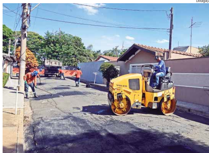
Rua Professora Ana Cândida de Mello Ferraz, no Jardim Primavera, recebeu os serviços de tapa-buraco na última semana

BAIRROS E RESPECTIVAS VIAS ATENDIDAS: Água Branca: rua Porto Alegre, rua Amélia Carraro Pavão, rua Antonio Carlos Pedroso, rua Marcelino Ferreira, rua Laudir Landre Barbosa e rua Raul Aparecido Gardin; Artemis: avenida Maria Julia de Camargo Dini; Jardim Flamboyant: rua Sebastiana Siqueira Rodrigues; Jardim Maria Cláudia: rua Raul Ataíde; Jardim Prezotto: rua Sebastião Santos de Oliveira e rua Território do Acre; Jardim Primavera: rua Professora Ana Cândida de Mello Ferraz, rua Cecílio Elias, rua Henrique Wolguth, rua Melhem William Maluf, rua Benedito Tricânico, rua Leônidas Andrade Fogaça, rua Prof. João Teixeira de Lara e rua Prof. José do Amaral Mello; Morumbi: rua João Antonio Fischer, rua João Maciel e rua Jorge Zohlnher; Nova América: rua Frei Wilson, rua Miss Martha Wats, rua Santa Catarina e travessa