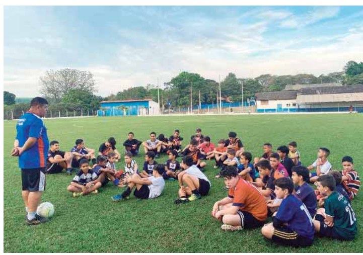
O Tupi FC mantém escolinhas de futebol destinadas a crianças e jovens

Outro projeto comentado pela vereadora é o 47/2024, que prevê a auditoria técnica do material empregado nas pavimentações. Rejeitada no ano passado, a matéria foi rerepresentada pela vereadora após discussão com a Semozel (Secretaria Municipal de Obras e Zeladoria). "O próprio secretário está apoiando o projeto e espero que agora seja aprovado", afirmou.