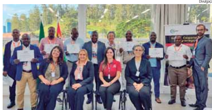
O curso de 'Seguro & Crédito Agrário' foi oferecido para uma comissão de diretores de Institutos de Pesquisa e Bancos de Desenvolvimento de Moçambique

Em mais uma parceria internacional o Pecege ofereceu, no fim de abril, um curso sobre 'Seguro & Crédito Agrário' para uma comissão formada por líderes e diretores de Institutos de Pesquisas e Bancos de Desenvolvimento da República de Moçambique - país localizado no sudeste do continente Africano.