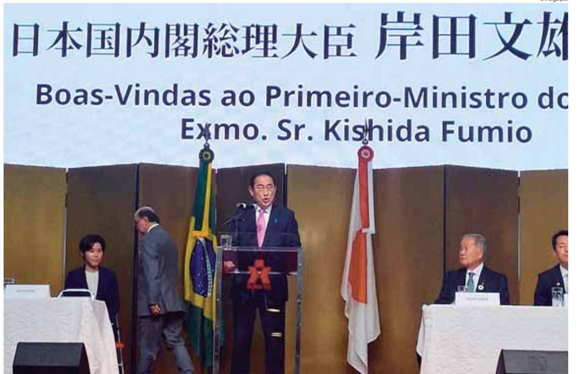
Primeiro-ministro japonês visitou o Brasil no último sábado (4), ocasião em que realizou discussões sobre relação entre os dois países