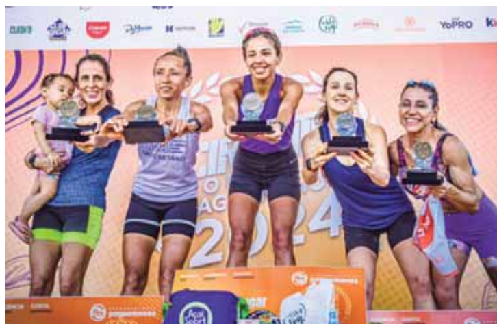
Valinhos pódio 10k Feminino