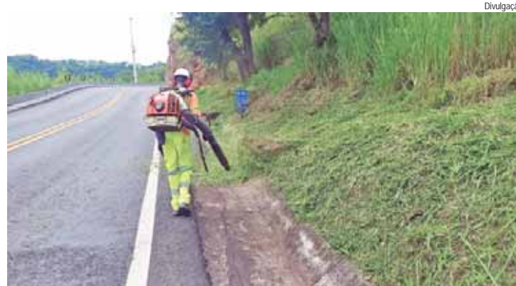
Sistema Pare e Siga será implantado na quarta e na quinta em razão dos trabalhos de manutenção entre Torrinhã e Santa Maria da Serra

O trecho de serra da SP 304 - Rodovia Geraldo de Barros, entre Torrinhã e Santa Maria da Serra, será parcialmente fechado nesta quarta e quinta-feira, dias 8 e 9, no período das 7h às 17h, para execução de serviços de manutenção. Equipes da Eixo SP Concessionária de Rodovias realizarão os trabalhos entre o km 232 e km 238, em ambos os sentidos, o que exigirá a implantação neste trecho do sistema Pare e Siga, para o controle da circulação de veículos.