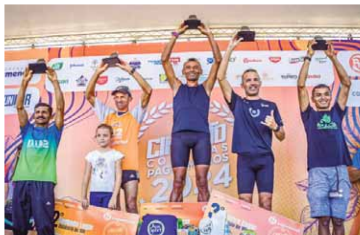
Valinhos pódio 10k Masculino