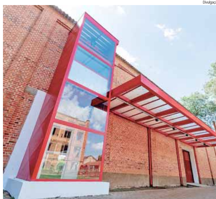
Elevador panorâmico dá acessibilidade inédita à Pinacoteca

Inauguração do espaço também contará com a abertura do 7º SAP (Salão de Aquarelas de Piracicaba). “Local dará maior visibilidade”, diz diretora