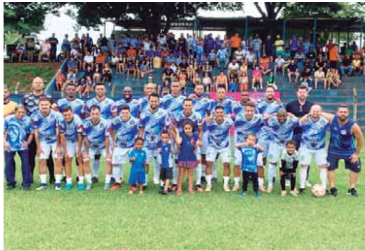
Equipe do Tupi FC atual campeã amadora de Piracicaba