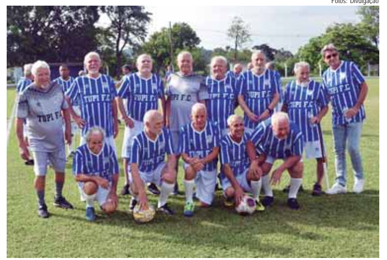
Tupi FC campeã do amador de 1972, em recente comemoração