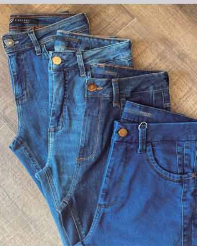
CALÇA JEANS A PARTIR R$259,90