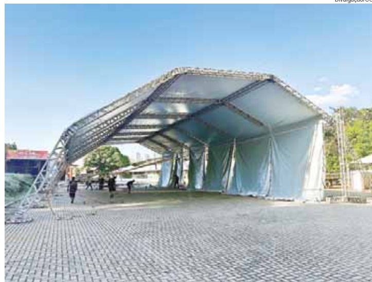
Equipes estão montando a Grande Tenda

PATROCÍNIO – Por meio da Lei de Incentivo à Cultura (Lei Rouanet), a 39ª Festa das Nações