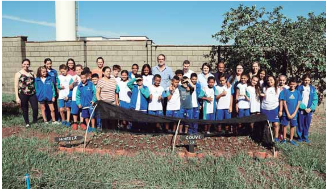
Projeto busca ampliar os espaços produtivos nas escolas, fomentando a educação ambiental, agricultura sustentável e alimentação saudável

O projeto Horta nas Escolas busca ampliar os espaços produtivos nas escolas, fomentando a educação ambiental, agricultura sustentável e alimentação saudável. As escolas selecionadas para participar e receber um "kit horta" da Sema foram selecionadas pela equipe da Secretaria de Educação por possuírem espaço adequado para receber a horta ou por já desenvolverem anteriormente alguma atividade de educação ambiental.