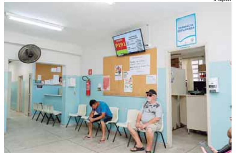
UBS Jardim Esplanada terá reforma total em sua infraestrutura interna e externa

Já na USF Jardim Vitória será feita remodelação nos sanitários da recepção, o consultório será transformado em sala de vacina, a copa dos funcionários será remodelada para melhor atender os funcionários. Atualmente, o acesso aos sanitários é pela copa, com a reforma, a entrada será individual, o sanitário PCD será transformado em um consultório, a sala de grupo será transformada em um consultório e uma sala de grupo menor. A unidade receberá piso em granilite e terá o re-