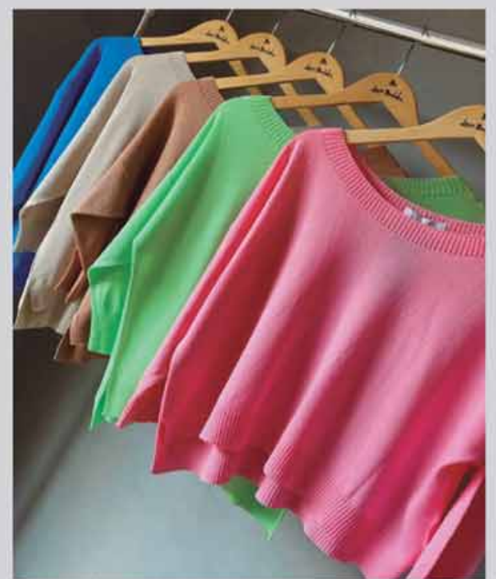
TRICOT ZARA R$149,90