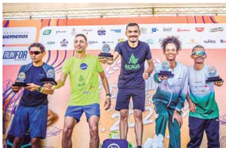
Valinhos pódio 5k Masculino

As próximas etapas do Circuito Corridas Pague Menos estão programadas para as cidades de Itu (16/6), Piracicaba (29/9), Mogi Guaçu (20/10) e Campinas (17/11). As inscrições para todas as etapas já estão disponíveis no site https://www.corridapaguenos.com.br/