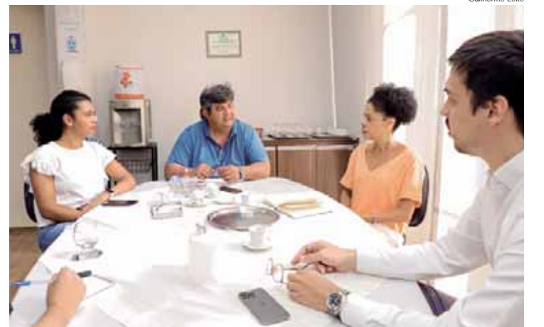
Parceria visa formação em temas como esgotamento sanitário, sustentabilidade e mudanças climáticas

O próximo passo da parceria será a apresentação de uma proposta por parte da Mirante já com