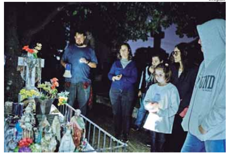
Roteiro Saudade e Suas Vozes conta histórias e lendas urbanas de Piracicaba no Cemitério da Saudade

ROTEIRO NO CEMITÉRIO – Implantado em janeiro de 1860, o Cemitério da Saudade abriga túmulos de Prudente de Moraes, primeiro presidente civil do Brasil, do padre Galvão Paes de Barros, cujo túmulo está inserido na lenda de que, ao ser conduzido para o enterro no cemitério, teria caído no lugar onde está até hoje, porque quando o caixão caiu não houve força humana capaz de erguê-lo para deslocar a outro local. No Saudade também estão sepultados o pintor Almeida Junior e o maestro Erotides de Campos, entre outros nomes. As lendas também estão disponíveis no canal do projeto no YouTube www.youtube.com/c/OQUETEASSOMBRA .