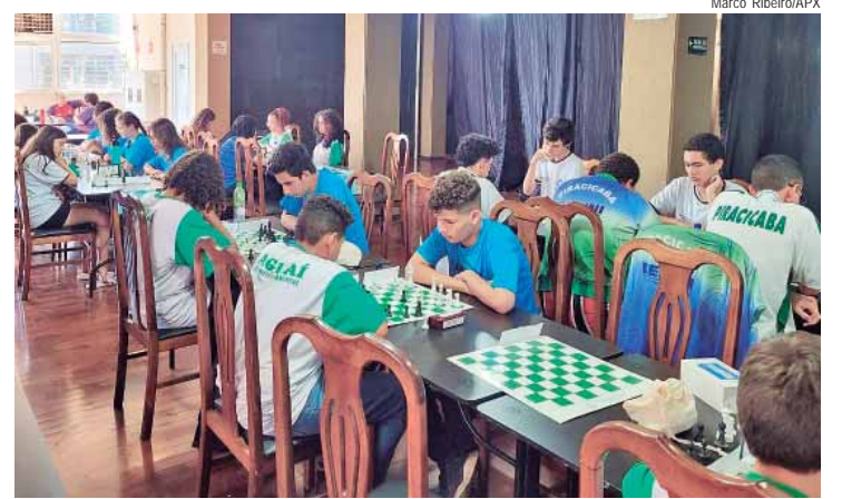
Jogos da Juventude, fase regional, em Rio Claro