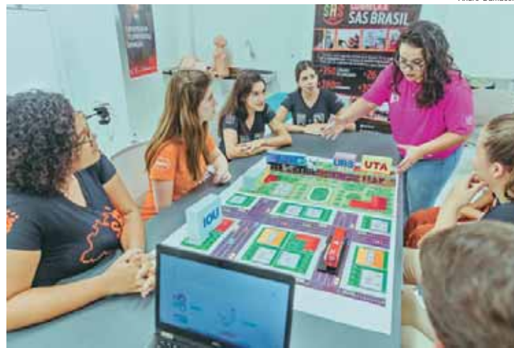
Estudantes participando do planejamento do Living Lab

Durante a inauguração, os participantes poderão acompanhar mesas de discussão sobre as estratégias de Saúde Digital no Brasil, apresentações de modelos de atuação inovadores e a realização de uma teleultrassonografia ao vivo. O momento também será marcado pela assinatura da carta-acordo entre a SAS Brasil, Unicamp e a Organização Pan-Americana de Saúde para a realização do primeiro núcleo de tele-saúde focado na saúde da mulher e no cuidado materno-infantil.