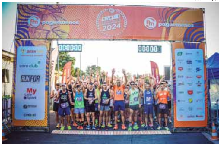
Evento em Valinhos aconteceu no último domingo (5)