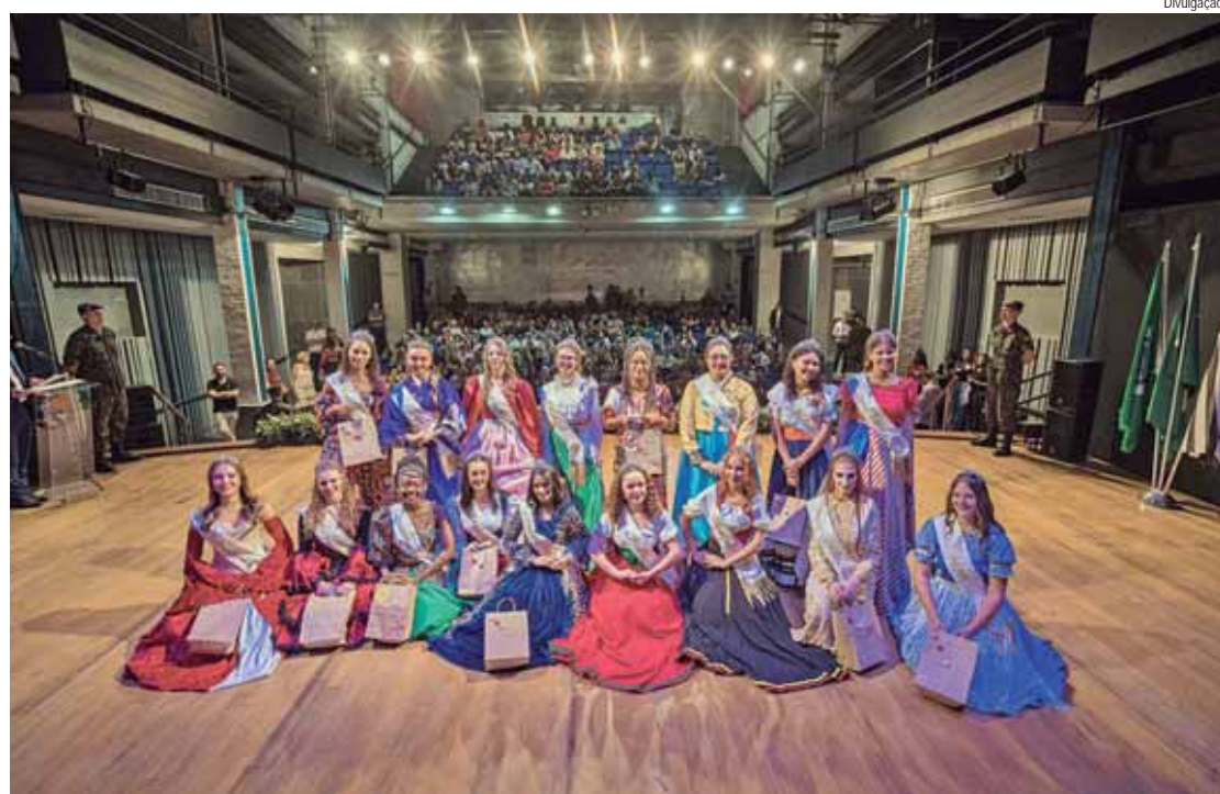
As Rainhas da 39ª Festa das Nações desfilam no Trenzinho Turístico no sábado, 04

PATROCÍNIO – Por meio da Lei de Incentivo à Cultura (Lei Rouanet), a 39ª Festa das Nações de Piracicaba é apresentada pelo Ministério da Cultura e pela Tools Digital Services. Os patrocinadores desta edição são Tools Digital Services, Caterpillar e Hyundai (Ouro); Drogal, Grupo Pirasa, Pecege e Unimed Piracicaba (Prata); e Arcelor Mittal, CJ Brasil, Embraplan,