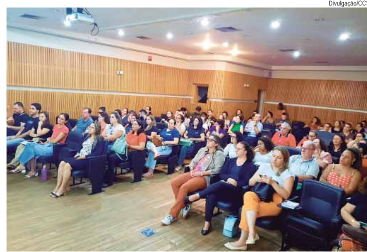
Representantes de OSCs participam de encontro sobre prestação de contas

Os dados enviados nas prestações de contas alimentam outros sistemas do governo federal, estadual e municipal tais como: Cad-Suas/MDS: sistema de cadastro do SUAS; Censo Suas/MDS: monitoramento por meio de formulário eletrônico; PMAS/WEB: sistema estadual de cadastro das informa-