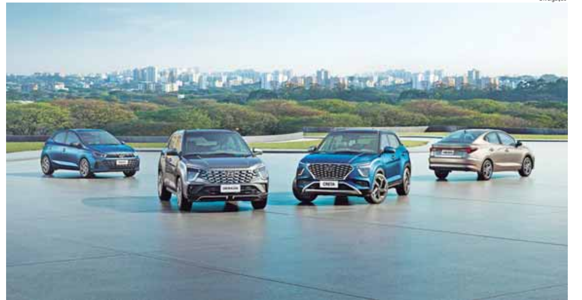
HB20 e Creta, fabricados em Piracicaba, chegam às concessionárias nas versões ano-modelo 24/25

GRATUIDADE ESTENDIDA – Junto a chegada das versões ano-modelo 2024/25, o período de degustação gratuita do sistema de conectividade veicular Bluelink foi estendido de três para cinco anos. Esse período de gratuidade