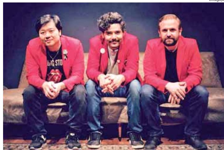
Os Londrinos, trio piracicabano de rock, abre o evento na sexta

Cada cervejaria participa com até quatro torneiras no evento, sendo que três delas de-