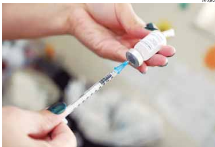
Vacinação contra a gripe foi ampliada ontem (2) para toda população com mais de seis meses de idade

A SMS reforça que durante a semana a vacinação acontece em todas as unidades de saúde