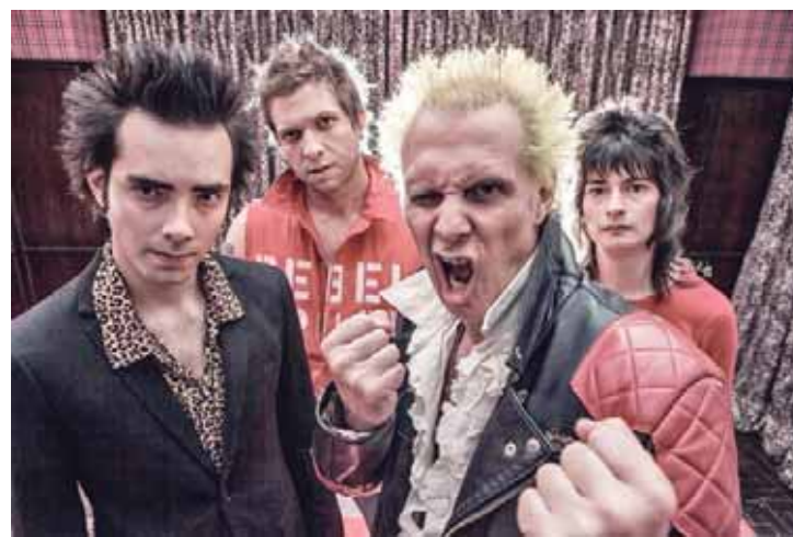
Supla e os Punks de Boutique encerram o evento, no sábado

nópolis – avenida Comendador Luciano Guidotti; Jd Astúrias – rua André Gianoni e rua Nelson Buldrini; Jd Gilda – rua Nair Azi Pitta e rua Deputado Roque Trevisan; Jupia – rua Francisca Alves Da Silva; Jardim Tatuapé – rua Igaratá e rua Irapuã; Mario Dedin – rua Pedro Paulo Santos; Monte Alegre – rua Horacio Rodrigues Tucunduva; Morumbi – rua Benedito Glicerio Teixeira, rua Gonçalves Dias, rua Jorge Zohlner, rua Professora Estefânia Novais, rua Roberto Mange e rua São Tomaz De Aquino; Nhô Quim – rua Coronel Manoel Inacio Da Motta Pacheco; Noiva Da Colina – rua Francisco Salmeron Aguilar e rua José Riolando Theodoro; Nova Iguaçu – rua Felisberto Pinto Monteiro e rua João Miguel Japur; Nova Piracicaba – rua Clemente Candido Gomes e rua Gabriel De Toledo Pizze; Pauliceia – rua Tupis; Piracicamirim – rua Benedito Glicério; Pq Conceição II – rua Rafaela Zanin; Santa Terezinha – rua Ipeúna, rua Itapevi e rua Marcelo Nogueira De Lima; Sete Barrocas – estrada Sete Barrocas; Vale Do Sol – rua Adolfo Ferraz, rua Angelo Carregari, rua Assis Chateaubriand, rua Barra Bonita, rua Olimpia, rua Pedro Paulo Carregari, rua São Pedro; Vila Cristina – rua Professor Arthur Madeira; Vila Sônia – rua Marcelo Nogueira De Lima.