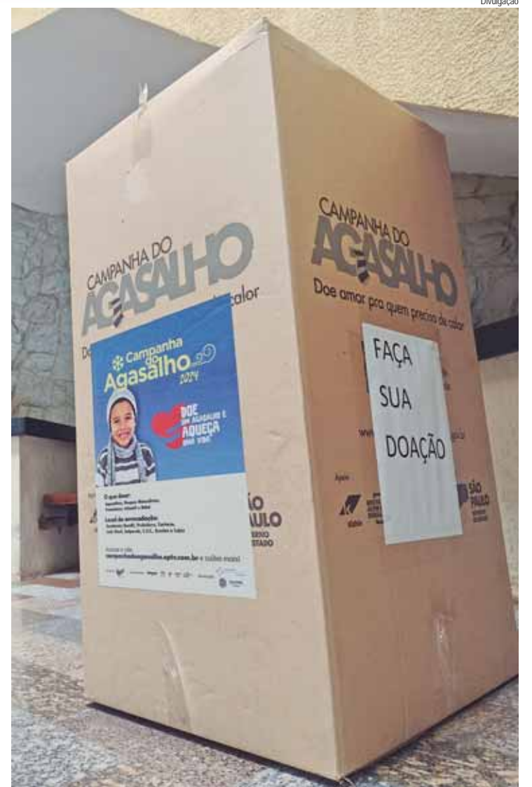
Órgãos públicos, incluindo a prefeitura, escolas e a própria Assistência Social, também estão participando da iniciativa

vens uma experiência cultural e educacional enriquecedora, utilizando a música como elemento central para as modalidades de capoeira, circo, teatro e hip hop. A iniciativa é uma realização conjunta do Governo Federal, através da Lei Paulo Gustavo, da Prefeitura Municipal, da Secretaria de Cultura e Turismo, e da Ariston Produções.