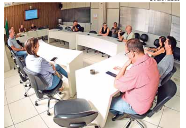
Pauta da reunião trouxe propostas de discussões de revisão do Plano Diretor de Inovação, com foco no Marco Legal

REPRESENTAÇÃO - integram a formação do Fórum: Associação Comercial e Industrial de Piracicaba (ACIPI), Associação das Empresas de Tecnologia de Piracicaba e Região ATEPI, Associação dos Engenheiros e Arquitetos de Piracicaba - AEAP, Associação