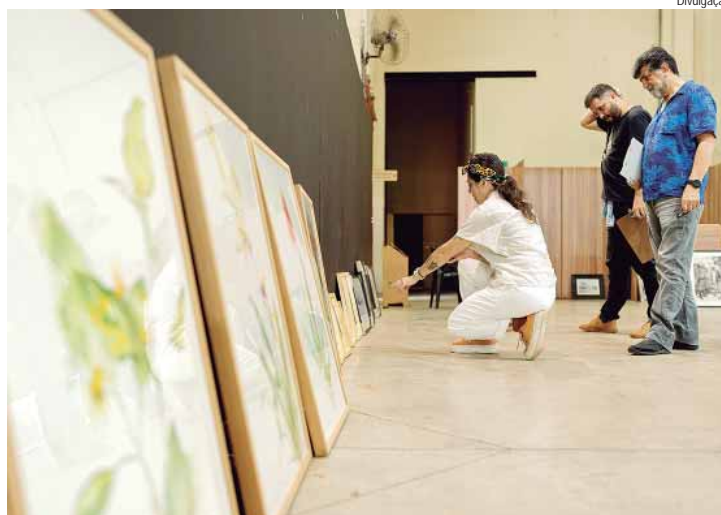
Juri de premiação e seleção aconteceu no Armazém 14 do Engenho