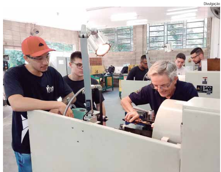
Todas as atividades foram supervisionadas pelos professores