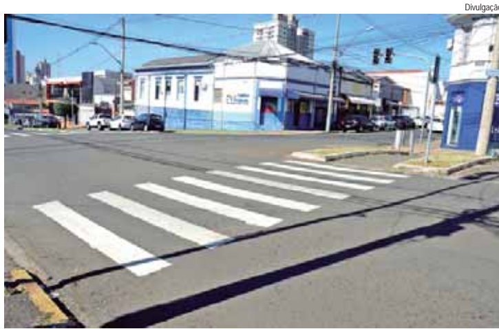
Avenida Independência com a rua Benjamin, com sinalização reforçada