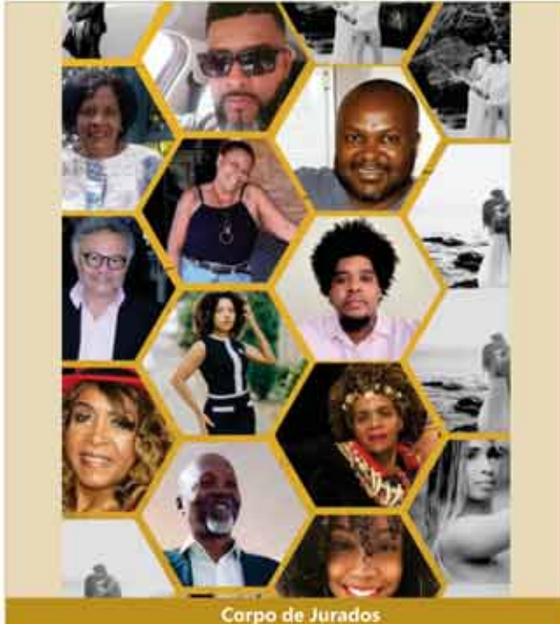
Corpo de Jurados