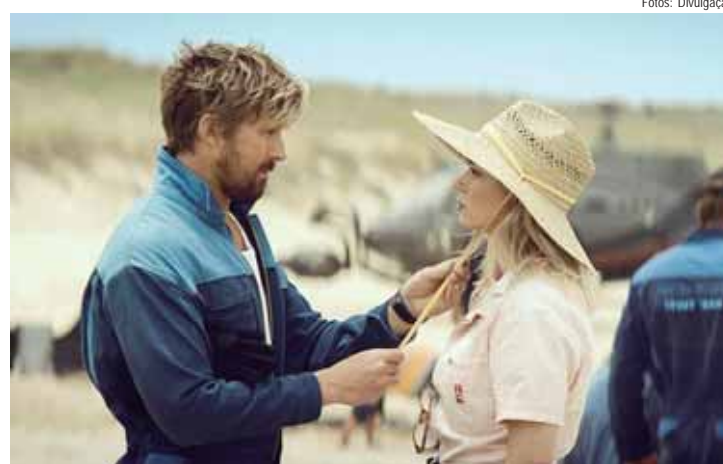
Ryan Gosling e Emily Blunt formam um romance sexy e explosivo no eletrizante O Dublê, já eleito como uma das melhores comédias do ano

"GUADALUPE - MÃE DA HUMANIDADE" (Guadalupe - Madre de la Humanidad) é um emocionante documentário religi-