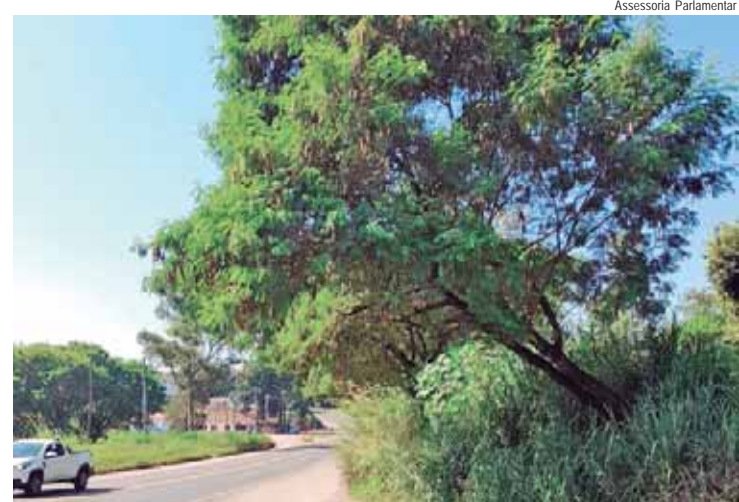
Poda de árvores, corte de mato e estudos para redução da velocidade e conversões proibidas foram solicitados

programa já pagou cerca de R$ 580 mil aos participantes aprovados. O último pagamento foi entregue no evento Workshop Pagamento por Serviços Ambientais, realizado no último dia 16 de abril, para os 13 produtores rurais e agricultores que participaram do programa PSA de 2023, somando o total de R$111.491,20.