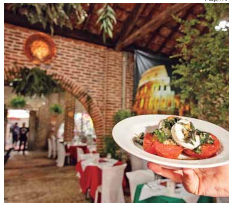
Os jantares serão oferecidos nos restaurantes Alemanha, Coreia do Sul, Espanha, Holanda, Itália, Japão e Suíça

39ª Festa das Nações de Piracicaba, apresentada pelo Ministério da Cultura e pela Tools Digital Services. De 15 a 19 de maio, no Engenho Central, avenida Maurice Allain, 454. Contatos com a Fenapi podem ser feitos pelo e-mail diretoria@fenapi.org.br . Site: www.festadasnacoes.org.br . Facebook: festadasnacoesdepiracicaba . Instagram: festadasnacoesdepiracicaba .