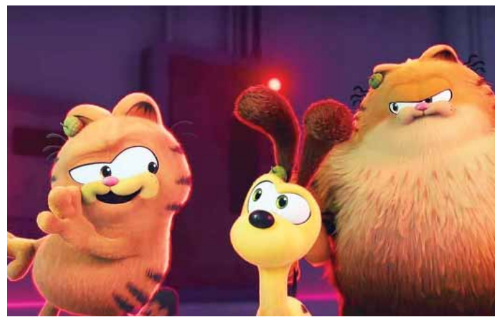
Na animação Garfield - Fora de Casa, o amado gato de estimação se junta ao seu pai Vic e o cãozinho Odie para um hilariante e arriscado assalto