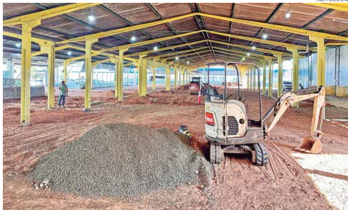
Varejão Municipal Central foi o primeiro varejão inaugurado em Piracicaba, há 42 anos

Aos sábados, das 6h às 12h, a comercialização acontece em duas das três faixas da avenida José Micheletti, atrás do Terminal Central de Integração (TCI), além da rua Dom Pedro I. A interdição dos trechos inicia à meia-noite de sábado, e segue até às 13h. Como rota alternativa, os motoristas que estiverem em direção ao centro da cidade também podem trafegar na rua Santa Cruz, e na avenida Independência, no cruzamento com a avenida 31 de Março.