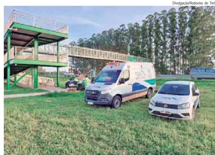
Café na passarela realizado em Lençóis Paulista, na Rodovia Marechal Rondon

O "Esquentando" teve como objetivo arrecadar fundos para o Centro de Reabilitação de Piracicaba. "A noite foi marcada por música, alegria e solidariedade, destacando a união em torno dessa causa nobre", salientaram os vereadores.