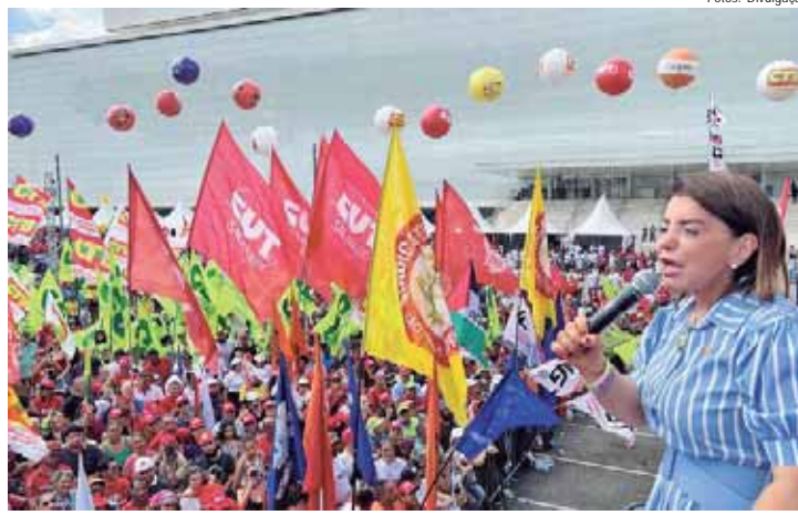
No ato das centrais sindicais, em São Paulo, Bebel destacou a importância dos trabalhadores para o desenvolvimento do Brasil