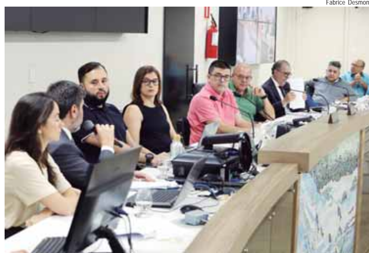
A audiência pública foi convocada pela Comissão de Finanças e Orçamento da Casa

Uma terceira recomendação sugeria à Prefeitura sanar as falhas apontadas em relação aos processos de licenciamento ambiental. Segundo o Executivo, "a única improbidade constatada já foi corrigida", com a estruturação do Sistema de Controle In-