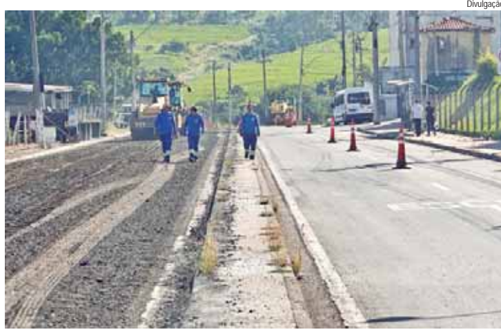
As obras estão concentradas em frente ao Condomínio Residencial Piracicaba 3