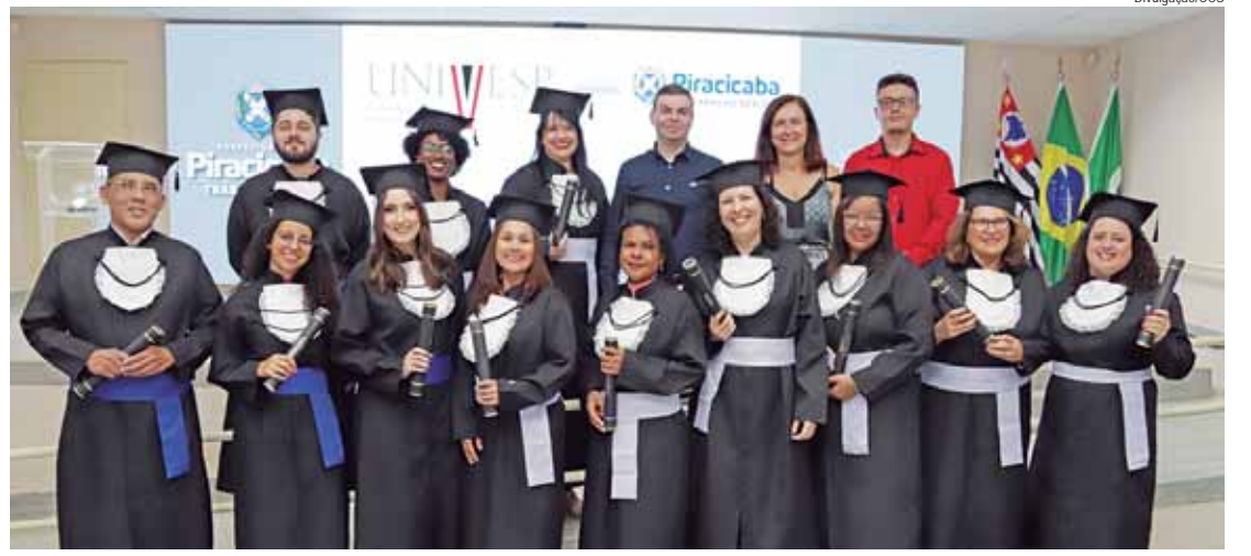
A colação de grau festiva dos formandos da Univesp 2023, em Piracicaba, ocorreu em fevereiro no anfiteatro da Secretaria da Educação

FALE — Em caso de dúvidas, o candidato poderá acessar o Fale Conosco do site da Univesp, ou, ainda, entrar em contato com o Disque Univesp, por meio do telefone (11) 3874-6300. Já o Polo de Piracicaba pode ser contatado pelo telefone (19) 3433-7747.