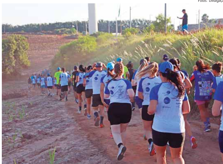
Provas de 3 e 6 quilômetros ocorreram em vias rurais de terra