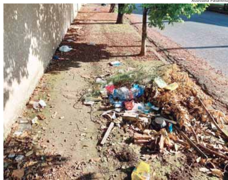
Podas de árvores e limpeza em trecho são solicitadas em indicações pelo vereador