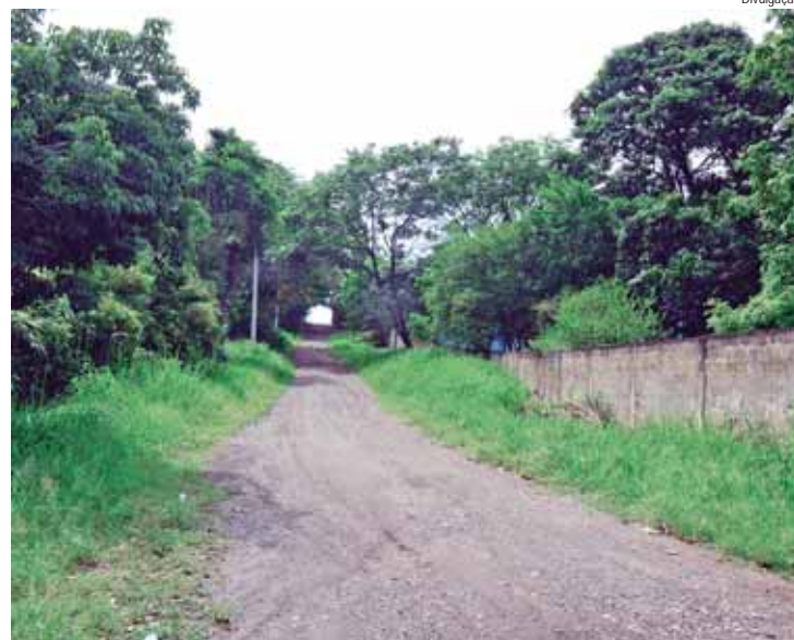
A obra na rua 10 de Novembro contempla galeria de águas pluviais e pavimentação

SANTA ISABEL – Outra obra na região é a pavimentação da estrada Santa Isabel, que está em andamento. A via está recebendo pavimento em cerca de 1,5 quilômetro. Além do pavimento, foi executada ainda adequação no sistema de drenagem de águas pluviais, com instalação de tubulação e construção de guias. A última etapa dos serviços compreende a construção de calçadas. No total, serão 10.500 m2 atendidos pelos serviços, com investimento de R$ 3.050.010,47. As obras são demandas do Orçamento Participativo e eram pedidos antigos dos moradores da região, agora atendidos pela Administração.