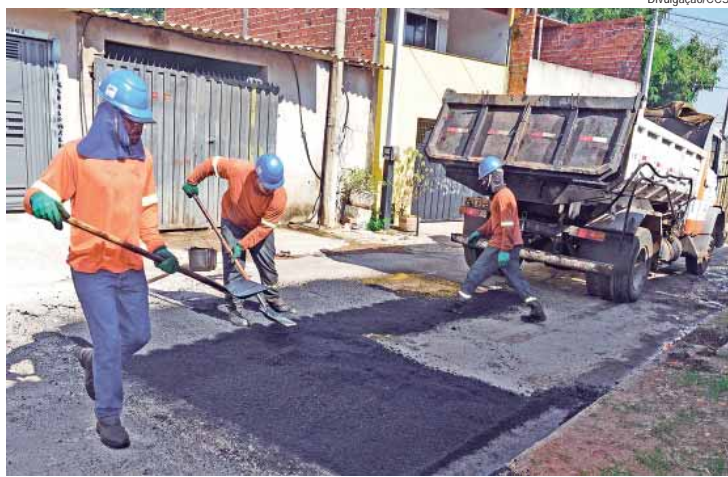
Rua Igaratá, no Jardim Tatuapé, recebeu os serviços de tapa-buraco na última semana

A Prefeitura de Piracicaba, por meio da Secretaria Municipal de Obras e Zeladoria (Semozel), executou serviços de tapa-buraco na semana de 22 a 26 de abril, em 47 vias do município, entre avenidas, ruas, travessas e rodovias. Ao todo, as equipes percorreram 26 bairros. Por meio da operação Tapa-buraco, a Semozel atende solicitações da população via SIP (Serviço de Informações à População) – 156 e vereadores, além das necessidades pontuais que as equipes verificam nas vias que percorrem.