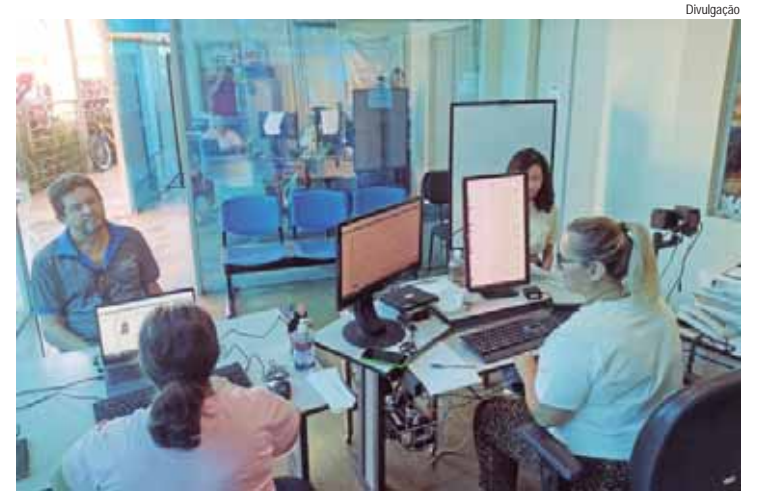
Posto estará em funcionamento das 11h às 17h

Com a data final se aproximando para quem deseja tirar ou regularizar o título de eleitor e participar das eleições de 2024, o Posto Eleitoral, localizado junto à prefeitura de Rio das Pedras, estará em plantão especial.