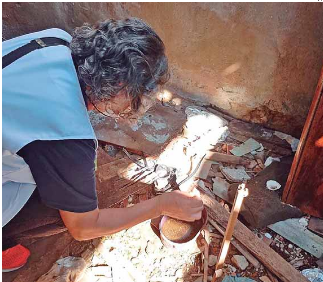
Equipes adentraram uma casa abandonada que representava alto risco de contaminação

Fique atento às próximas atividades e lembre-se: a prevenção é nossa melhor estratégia contra a dengue. Denuncie áreas que necessitam de atenção à Prefeitura, à Secretaria de Saúde e à Vigilância Sanitária.