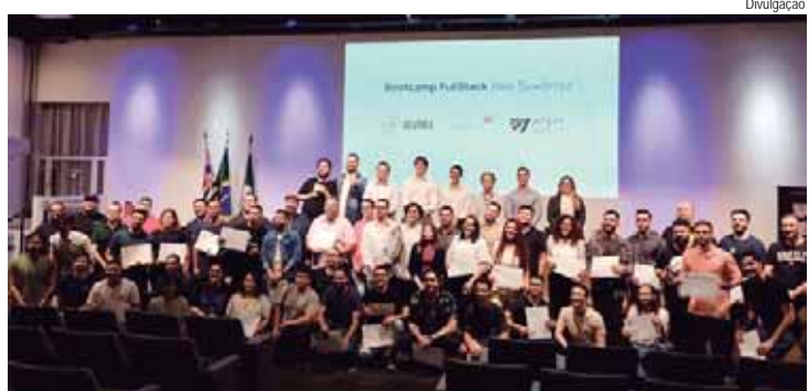
50 alunos se formaram no curso gratuito de programação oferecido pelo Pecege

Cerca de 50 alunos se formaram na sexta (26) no primeiro curso de programação, oferecido gratuitamente pelo Pecege, voltado para Front End e Back End - duas das mais avançadas tecnologias utilizadas no mercado atualmente.