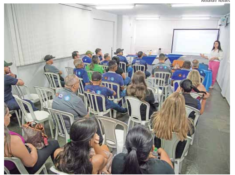
O encontro que reuniu diretores e funcionários da entidade