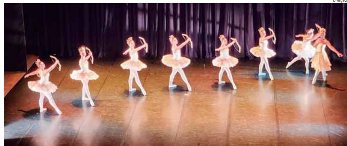
Adapi participa com coreografias na sexta-feira