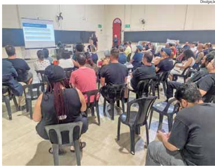
Semac apresentou o Plano de Ação da Lei Aldir Blanc e terá nova reunião quinta (2)