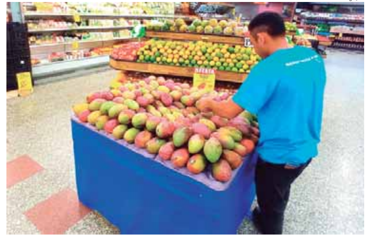
No comércio, associadas Acipi garantem empregabilidade para 17.136