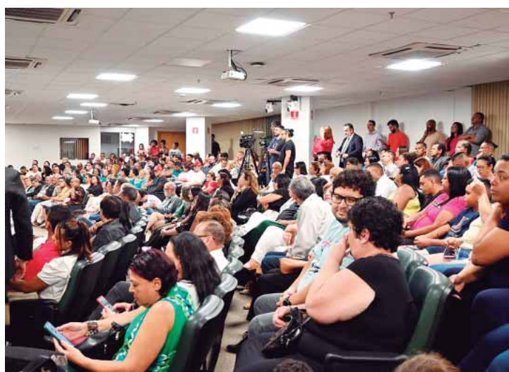
A solenidade de entrega do prêmio foi amplamente prestigiada por lideranças políticas e sociais

Além dos PEIs, o estado também conta com uma estrutura composta por 233 Postos de Atendimento ao Trabalhador (PATs) espalhados pela capital, interior e litoral, que são referências das políticas públicas de geração de emprego e renda e fornecem informações e orientações ao trabalhador, além de auxiliar os empregadores na busca de recursos humanos, promovendo o encontro de ambos entre quem procura emprego e quem tem uma vaga para oferecer, dentre outros serviços.