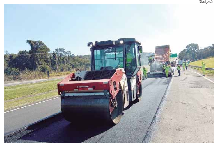
Equipes atuarão nos próximos dias em trechos da Rodovia Washington Luís em Corumbataí, Rio Claro e Cordeirópolis

1º DE MAIO - Quero externar minhas homenagens a toda classe trabalhadora de Piracicaba, do Estado de São Paulo e do Brasil nesta data em que celebramos o Dia do Trabalhador, comemorado nesta quarta-feira, 1º de maio. Gostaria de ressaltar a luta dos trabalhadores em diferentes momentos da história por direitos e garantias que gradativamente representaram importantes conquistas sociais e econômicas. Se temos algo para exaltar no dia de hoje é a grandeza do ser que, mesmo anônimo, tanto contribui para a sociedade com o suor.