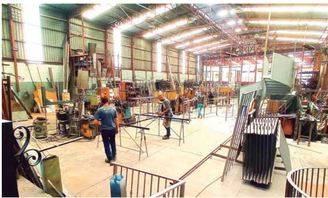
Na indústria, associadas Acipi atuantes na indústria somam 39.129 empregos