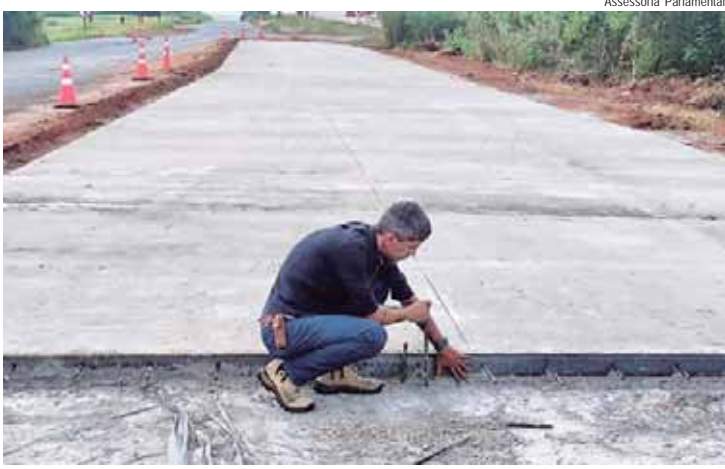
Polezi esteve no distrito industrial Unileste para acompanhar o início da troca da pavimentação asfáltica pela pavimentação em concreto