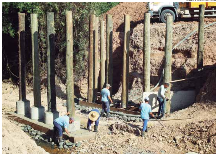
Ponte no bairro Jiboia está em processo de reconstrução

Atendendo ao cronograma diário de atividades e solicitações de moradores da zona rural, a Prefeitura de Piracicaba, por meio da Sema (Secretaria Municipal de Agricultura e Abastecimento), esteve na última semana, de 22 a 26/04, realizando melhorias em seis estradas e uma ponte de madeira da zona rural do município.