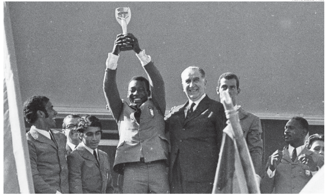
Pelé ergue a Taça Jules Rimet ao lado do então presidente Emílio Garrastazu Médici

O Rei do Futebol conquistava, aos 29 anos, sua terceira Copa do Mundo, feito inédito até os dias de hoje. No campeonato, Pelé foi o protagonista de lances avaliados pelos apaixonados pelo esporte como alguns dos mais lindos da história do futebol. Além dos quatro gols marcados ao longo da campanha, lances que não resultaram em gol também são notáveis: o chute do meio de campo contra a Tchecoslováquia; o quase-gol contra o Uruguai que virou tema do livro "O Drible", de Sérgio Rodrigues; a cabeçada defendida pelo goleiro inglês Gordon Banks. As "jogadas de cinema" marcaram a última participação do maior artista da bola em mundiais.