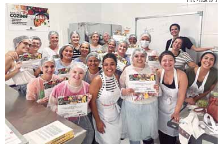
Cursos oferecidos pela Cozinha Experimental são gratuitos

capacitados para liderar e aprofundar discussões de forma realista e harmoniosa, garantindo sustentabilidade e respaldo técnico em atendimento às reais necessidades do setor produtivo e da comunidade; revelando o comprometimento da Escola com as transformações sociais.