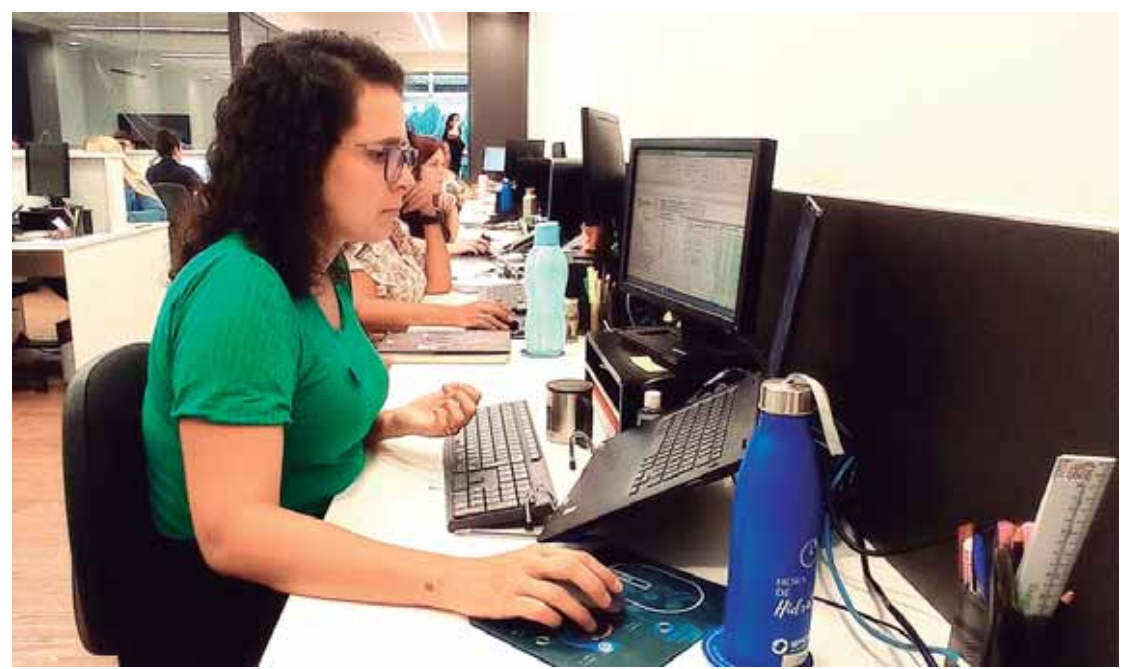
O setor de serviços, entre as associadas Acipi, concentra 17.273 empregos