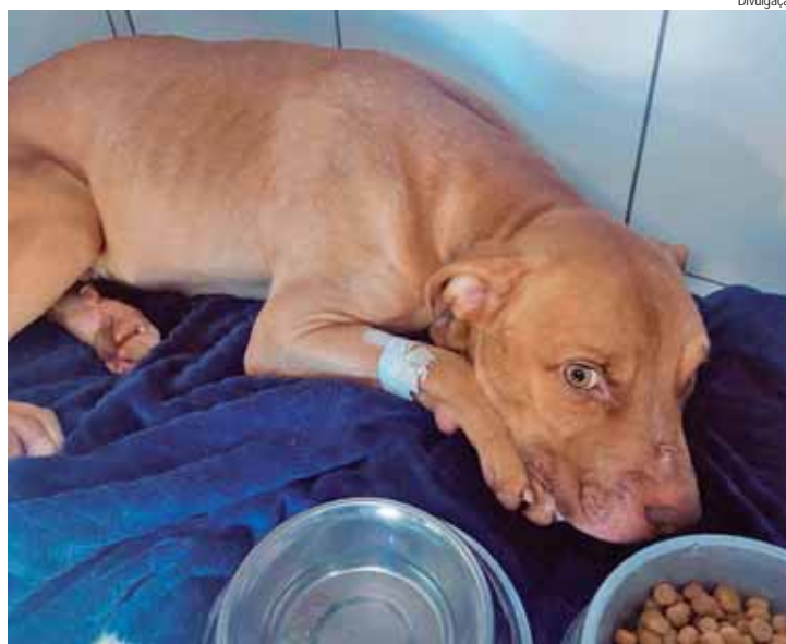
Pitbull resgatado em estado crítico se recupera após receber atendimento no DBEA

O cão da raça pitbull foi encontrado deitado no quintal do imóvel aos fundos em estado crítico de saúde, em uma área cheia de fezes e sem cobertura do sol. O filhote também foi encontrado na casa em es-