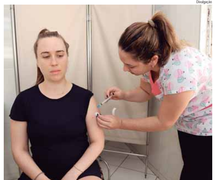
O grupo prioritário inclui todos os professores das escolas do ensino básico e superior, de caráter público e privado

Público-alvo da Campanha Nacional de Vacinação contra a Gripe (Influenza): crianças de 6 meses a menores de 6 anos; trabalhadores da saúde; gestantes; puérperas; professores do ensino básico ao superior e funcionários das