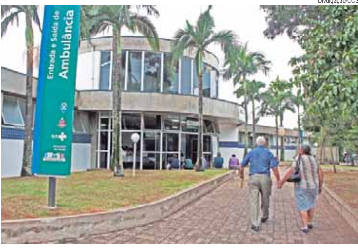
Processo de modernização na UPA Vila Rezende começa amanhã (02)