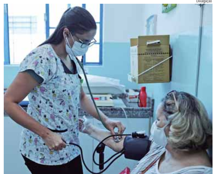
Piracicaba terá Plenária Municipal de conferência nacional que abordará a gestão do trabalho e da educação na Saúde

CENÁRIO ATUAL – Segundo levantamento divulgado recentemente pelo CNS, o Cadas-